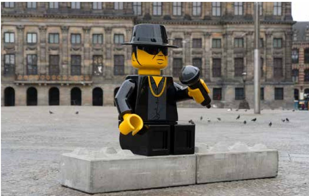
Lego Andre Hazes op de Dam in Amsterdam