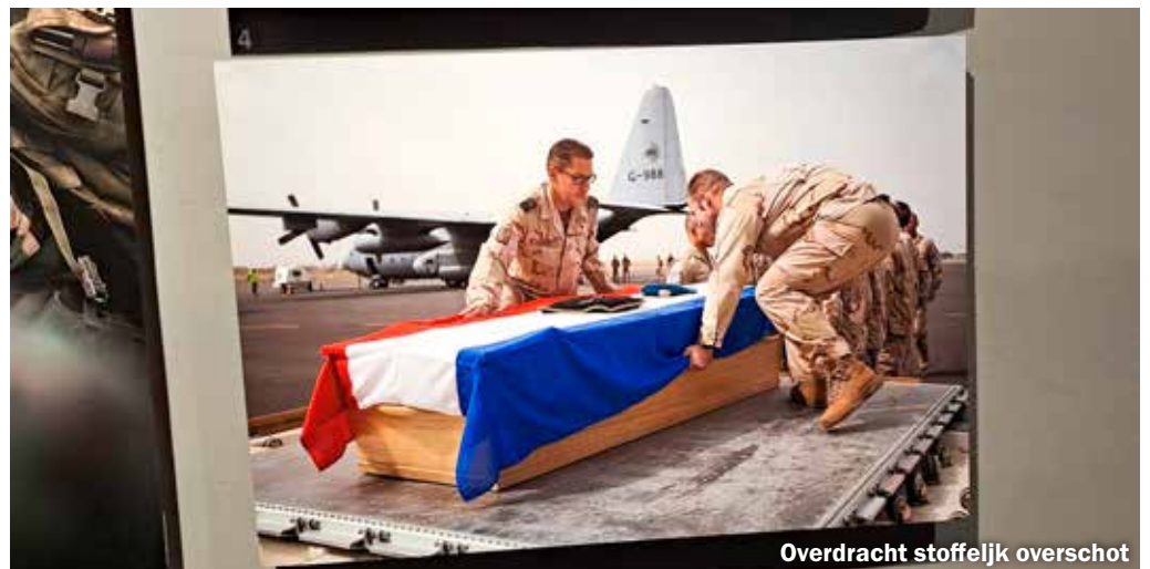
Overdracht stoffelijk overschot