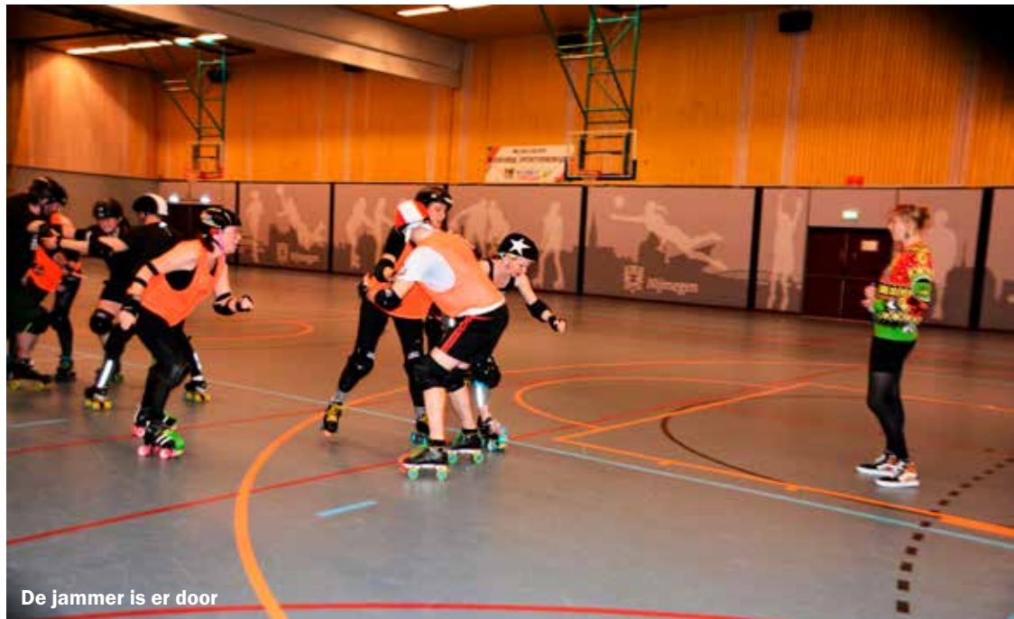
De jammer is er door

mag meedoen. Het is een vrij inclusieve club. Vrouwen zijn wel in de meerderheid.