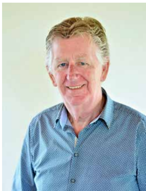
Samenstelling en foto: Leo Venderbosch

Mail mij: lavenderbosch@kpnplanet.nl of bel mij: of 06 51 21 50 55.