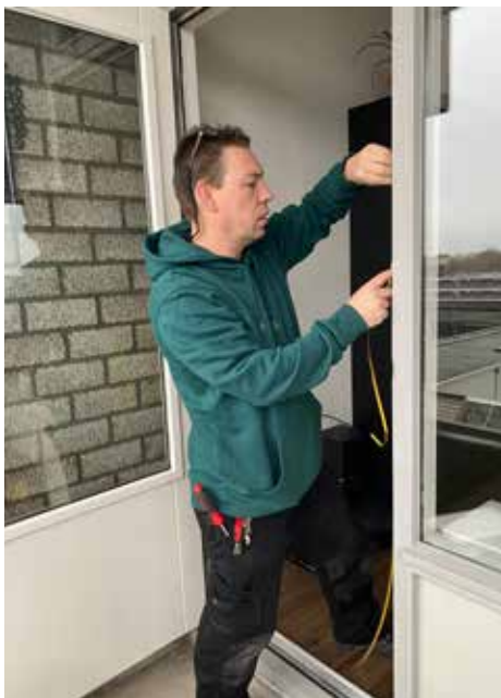
Aanbrengen van tochtstrips

en elektriciteit). De energiecoach geeft u bruikbare, handige tips én advies op maat. Kijk op nijmegen.nl/energiecoach voor de gratis hulp van een energiecoach.