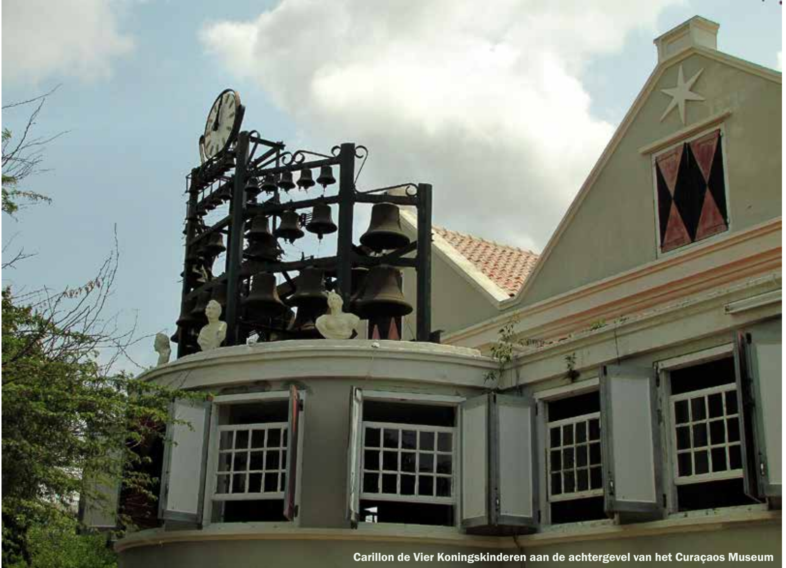
Carillon de Vier Koningskinderen aan de achtergevel van het Curaçao Museum