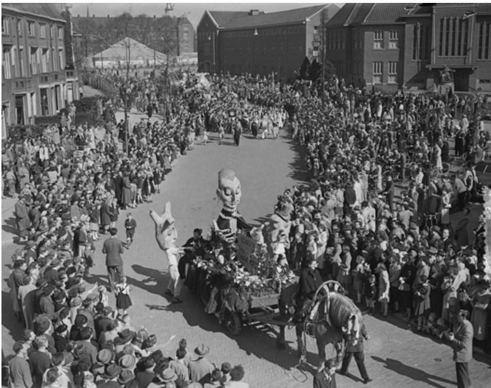
Aankomst Prins Carnaval en optocht in Nijmegen, 19 april 1953

vinden en gingen er zelfs aan meedoen! Zuidelijk in Limburg ziet men na de oorlog vooral door de tv-uitzendingen de opkomst van het Rijnlandse carnavalsmodel, met de verkiezing van een Prins Carnaval, de opkomst van de Raad van Elf en dergelijke. Dit gaat ten koste van de Bourgondische viering. Carnaval kreeg toen meer het karakter van een straatfeest, met vrolijke optochten. Bij de carnavalszittingen ziet men buutreednen , waarbij de sprekers vaak grappen maken over het lokale bestuur. Ook in de carnavalsoptocht in kleinere plaatsen worden publieke en politieke zaken op de hak genomen.