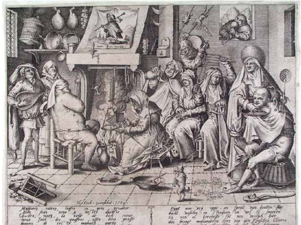
Vastenavond, Pieter van der Heyden, 1567

In de zestiende eeuw kwam aan de openbare en massale carnavalsviering uit de middeleeu-