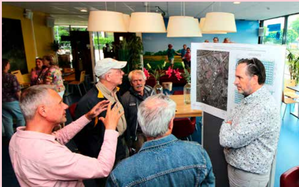
Informatiebijeenkomst over een zwembad in Winkelsteeg, dinsdag 21 juni 2022

Er komt een nieuw zwembad aan de Nieuwe Dukenburgseweg in Winkelsteeg. Het wordt gecombineerd met een nieuwe sporthal. Dat heeft de gemeenteraad op 21 december 2022 besloten.