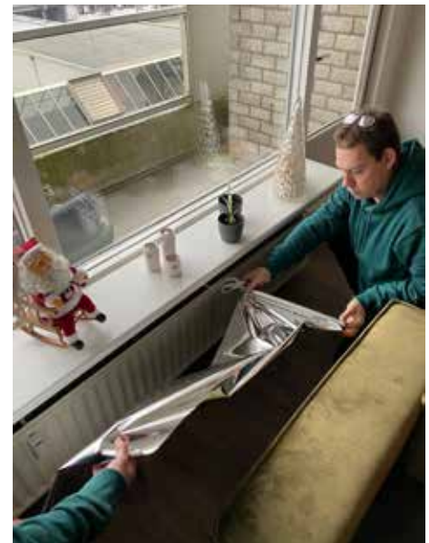
Plaatsen van radiatorfolie

Het project met EnergieFixers helpt mensen in koopwoningen én huurhuizen, zowel laagbouw als hoogbouw. Ook in Tolhuis en Weezenhof staan wooncomplexen die met hetzelfde te maken hebben: hoge energiekosten en gemiddeld veel