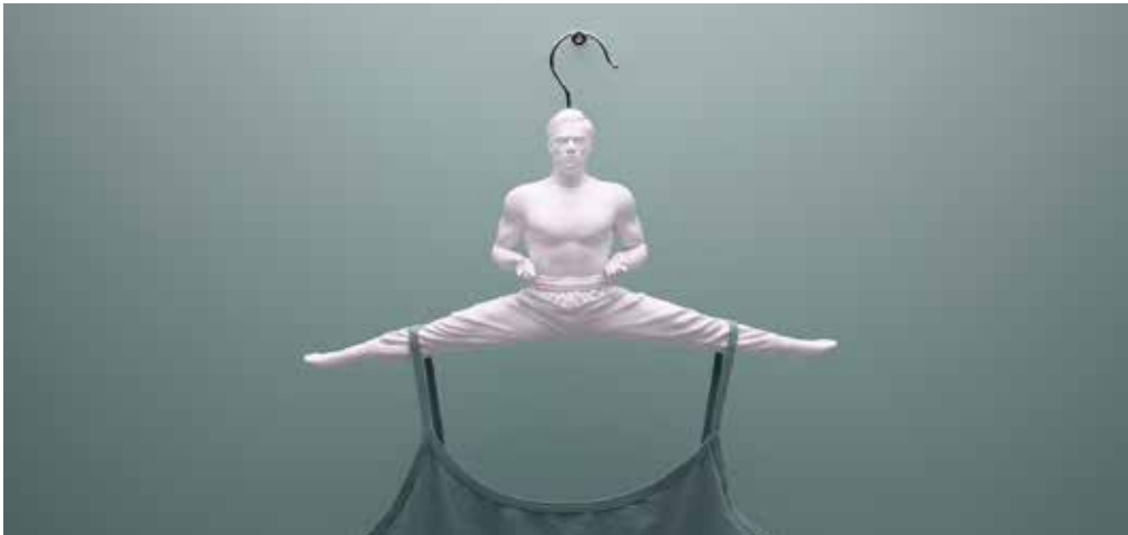
Jean's Clothes van Damme