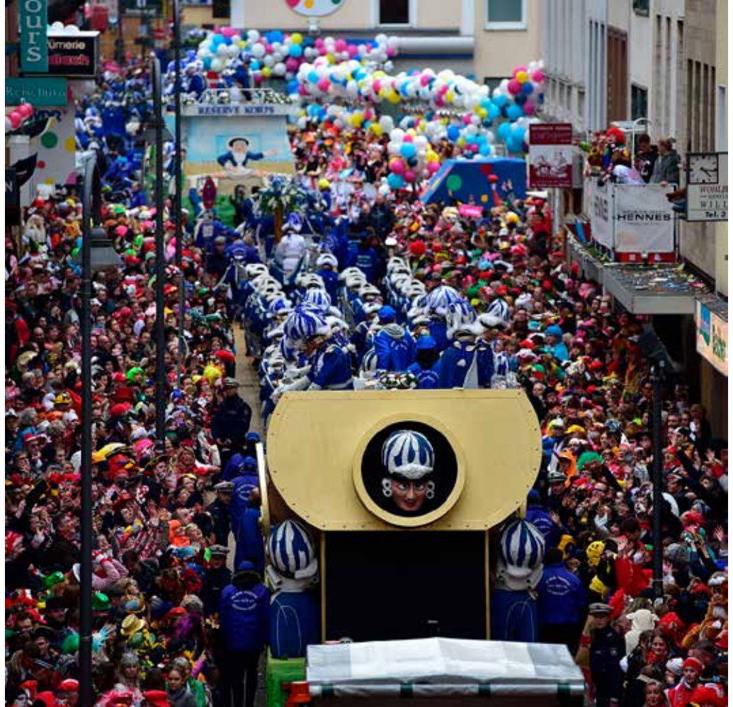
'Rosenmontag' in Keulen. Dit jaar is het 200 jaar geleden dat de eerste optocht gehouden werd

Na de Tweede Wereldoorlog zien we een herleving van het carnaval. De overgrote meerderheid van de carnavalsverenigingen zijn toen pas opgericht. De Blauwe Schuit van Nijmegen bijvoorbeeld dateert van 1948, De Tempeliers van Maastricht van 1949. In de ja-