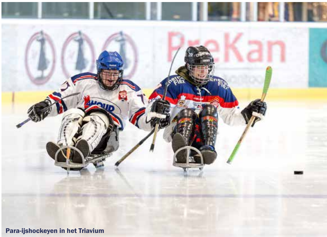
Para-ijshockeyen in het Triavium

Materiaal om te spelen, zoals slee en tenue, was nog niet aanwezig. Dit werd door Amsterdam Tigers beschikbaar gesteld. Binnen acht maanden had ook Nijmegen een para-ijshockeyteam, onderdeel van ijshockeyvereniging Nijmegen Devils en was daarmee de derde