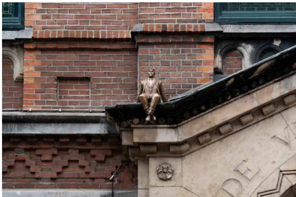
Burgemeester Eberhard van der Laan bij Paradiso