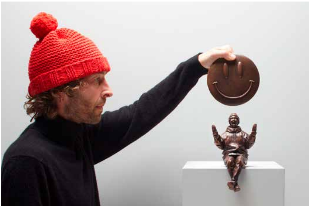
Frankey: Say smiley