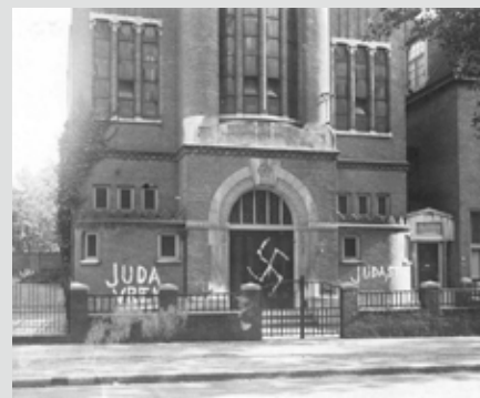
Synagoge in de Gerard Noodtstraat, donderdag 28 augustus 1941

Theatergroep GRAS zoekt ouderen voor een officieel jongerenproject van Theater na De Dam