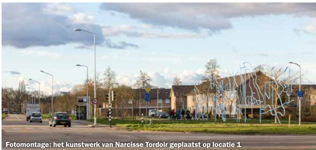
Fotomontage: het kunstwerk van Narcisse Tordoir geplaatst op locatie 1

In de Dukenburger nummer 2 van maart 2021 gaf de gemeente vier locaties aan waar het kunstwerk van Tordoir zou kunnen komen. Op vrijdag 19 maart was er een bezichtiging van de voorgestelde plekken. Enkele belangstellende bewoners, leden van de commissie beeldende kunst en de betrokken ambtenaar hebben dat gedaan. Eerst gingen ze naar locatie 4: Meijhorst parkje. Daarna volgde locatie 3: Meijhorst 10 e straat/Van Apelterenweg. Locatie 2 was Van Apelterenweg/Malvert 10 e straat. Hier werden twee varianten bekeken: