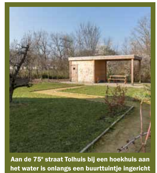
Aan de 75° straat Tolhuis bij een hoekhuis aan het water is onlangs een buurttuintje ingericht