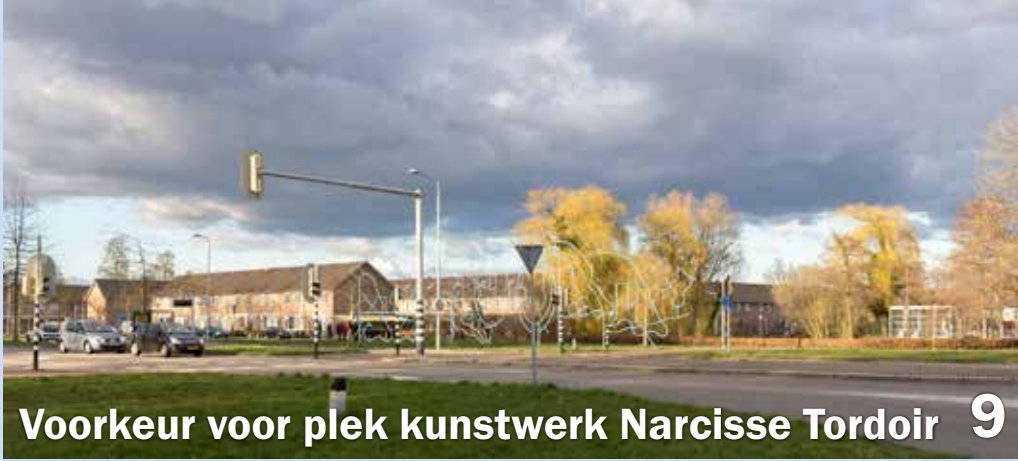
Voorkeur voor plek kunstwerk Narcisse Tordoir 9