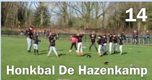
Honkbal De Hazenkamp 14