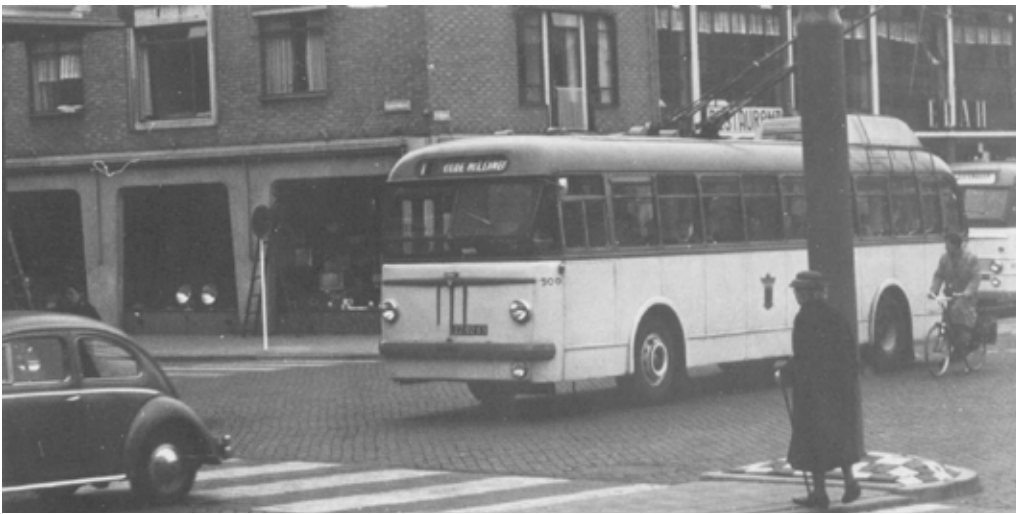
Trolleybus van lijn 1 op Plein 1944. Foto: Fotopersbureau Gelderland, 12 december 1958.

worden. Het trolleybusnet is inmiddels reeds gedeeltelijk in gebruik genomen, terwijl het nog te bouwen gedeelte binnen afzienbare tijd in exploitatie zal komen.