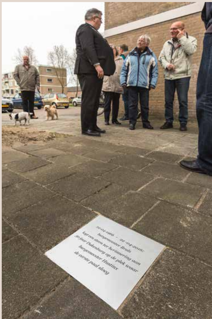
Burgemeester Bruls op 22 april 2016 in gesprek met buurtbewoners na de onthulling van de gegraveerde stoepstegel in de buurt van de plek waar in 1966 de eerste paal van Dukenburg de grond in ging.

Dukenburg kreeg gaandeweg een wijklied en een vlag. Deze was wit met groen en lichtblauw van lucht en/of water, misschien ook een toefje geel. Als hommage aan de eenden(-kuikens) in onze kanalen, weteringen en sloten.