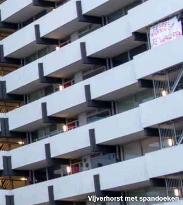
Vijverhorst met spandoeken