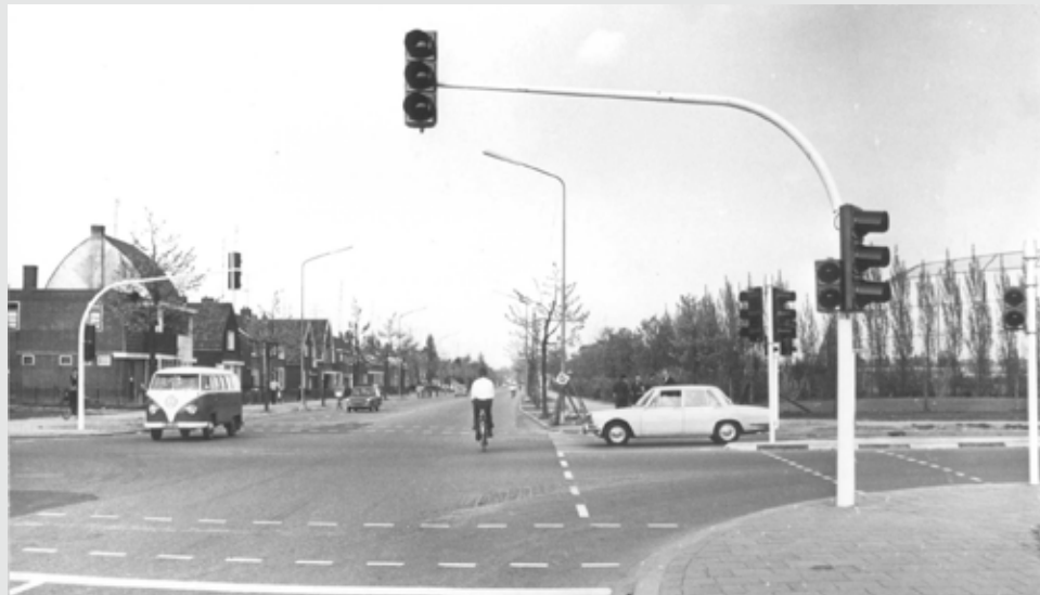
Hatertseweg, Weg door Jonkerbos (l), Grootstalselaan (r). Links Het Wiegje, 6 mei 1969.

(Google Tako voor meer informatie over zijn persoon.)