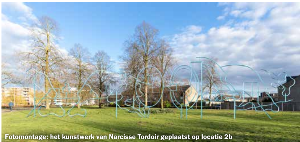
Fotomontage: het kunstwerk van Narcisse Tordoir geplaatst op locatie 2b

een waarbij het kunstwerk min of meer parallel komt aan Malvert 10 e straat (variant 2a) en een waarbij het kunstwerk parallel komt aan de Van Apelterenweg (variant 2b). De tocht eindigde bij locatie 1: hoek Van Boetbergweg/Van Apelterenweg. Bij deze locatie moeten enkele jonge bomen verplaatst worden.