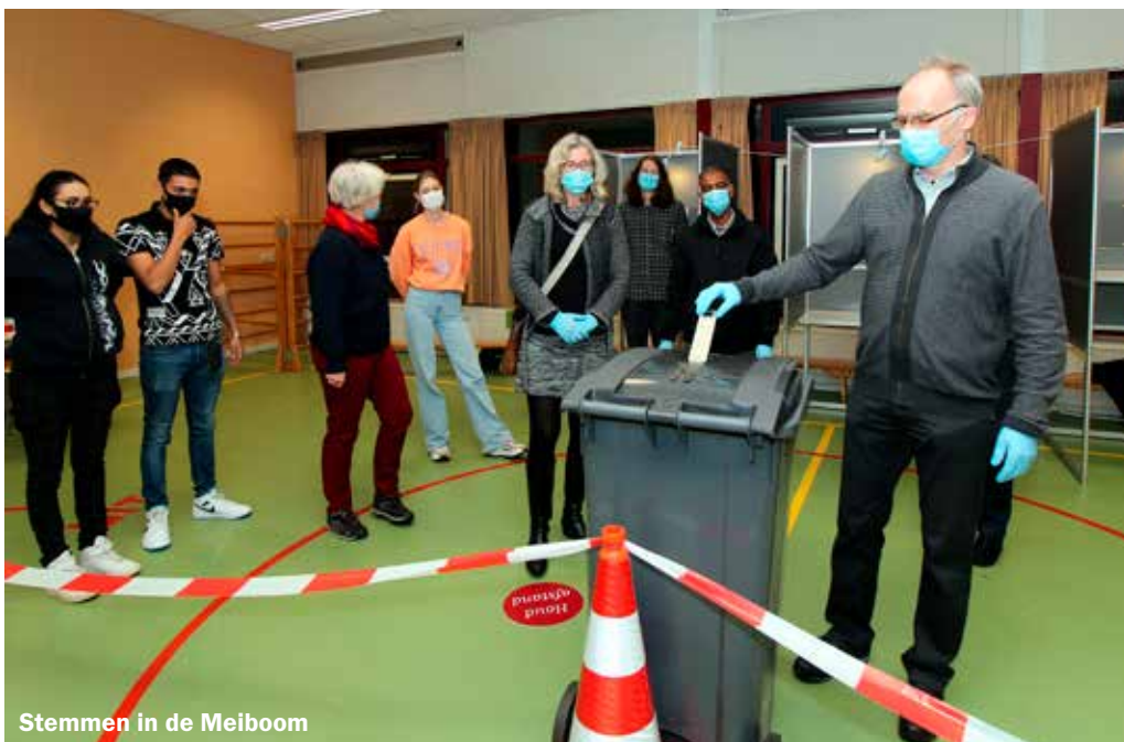
Stemmen in de Meiboom

Het is de meest directe manier om mee te doen in een democratie: stemmen. Stemmen in vrijheid. Waar Nederlanders in het openbaar kunnen zeggen of schrijven wat zij willen en in vrijheid hun democratische stem kunnen uitbrengen, is dit voor miljarden mensen in de wereld niet mogelijk. Wij keken op woensdag 17 maart mee op het stembureau in de Meiboom in Meijhorst bij het stemmen en waren bij het uitvouwen van de biljetten en het tellen.