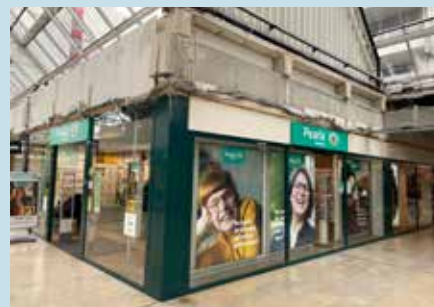
Loshangende bekabeling bij Pearl