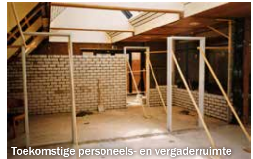
Toekomstige personeels- en vergaderruimte

Volgens de nieuwe richtlijnen moesten medewerkers gedurende de pauze rustig kunnen zitten, zonder gestoord te worden. Tevens moesten douches en toiletten gebouwd worden voor vrouwelijke en mannelijke medewerkers. Zij maakten noodgedwongen nog steeds gebruik van de sanitaire voorzieningen in de publieke ruimte. Niet optimaal dus. Naast een nieuw verblijf voor medewerkers werd ook een vergaderruimte gebouwd die een rol moest spelen in de exploitatie van het zwembad. Sportfondsenbad Dukenburg kon daardoor beter gepro-moot worden als landelijk cursusbad.