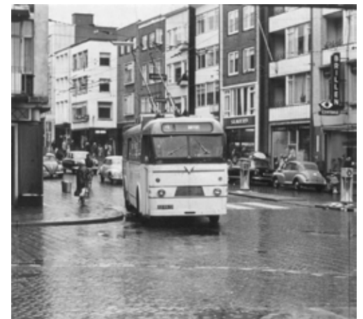
Trolleybus van lijn 4 in de Augustijnenstraat. Foto: Fotopersbureau Gelderland, 22 augustus 1964.

(...) Een van de belangrijkste veranderingen, vergeleken bij de route welke de tram maakt, is het feit, dat de trolley niet het Keizer Karelplein zal aandoen, maar wel in de buurt daarvan, bij de In de Betouwstraat, stopt. Deze maatregel wordt genomen