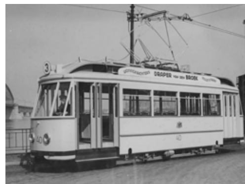
„De geheel verbouwde tram, waarover met lof in bijgaand artikel wordt gesproken, Naar wij vernamen zou het Nijmeegse trambedrijf in staat zijn nog een dertiental van deze wagens op de lijn te zetten.” Foto: Fotopersbureau Gelderland, 25 maart 1949.

In Arnhem was het veel moeilijker een gelukkige oplossing te vinden, omdat die stad weliswaar practisch al haar materiaal verloren was, waaronder het allernieuwste, maar toch nog wel een uitgebreid railcomplex bezat, waarvan misschien nog belangrijke gedeelten bruikbaar zouden zijn, terwijl de lijn van Velp naar Oosterbeek een grensgeval tussen tram en trolleybus was. Uiteindelijk verkoos men een trolleybusnet, dat, evenals te Groningen met benzinebussen aangevuld zou