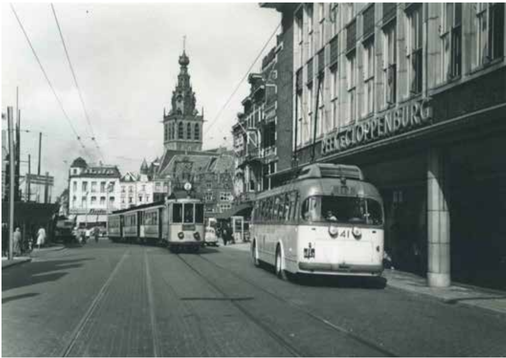
Een tram van lijn 2 en een trolleybus van lijn 1 in de Burchtstraat voor de modezaak van Peek en Cloppenburg met zicht op de Grote Markt en de St. Stevenskerk. Foto: Eduard Bouwman, 16 augustus 1954.

Op donderdag 25 mei 1950 besloot de gemeenteraad in alle vroegte over de toekomst van het stadsvervoer. De Gelderlander berichtte op dezelfde dag: