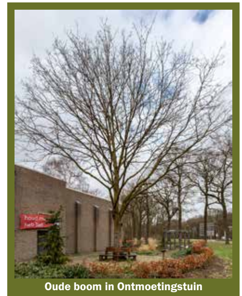
Oude boom in Ontmoetingstuin

Plantenasiel als een vorm van 'marktplaats' zijn in meerdere provincies te vinden. In Gelderland is Wageningen voor Nijmegen wellicht het dichtstbijzijnde adres. De mogelijkheden hier zijn: • adoptie, • ruilen, • doneren. Met de spelregels: geef een plant een nieuwe kans en adopteer er eentje. Om de kosten te dekken wordt er een geldelijke bijdrage gevraagd. Ruilen kan ook. Uitgekeken op je hibiscus of geen klik meer met die geranium? Ruil het groen om voor een andere plant. Het asiel neemt ook planten aan als donatie. De vrijwilligersclub zoekt er dan een nieuw tehuis voor. Het plantenasiel is te vinden op internet plantenasielwageningen@gmail.com , maar heeft als bezoekadres Stationsstraat 32, Wageningen, 06 18 91 48 93. De aangepaste openingstijden zijn daar na te vragen.