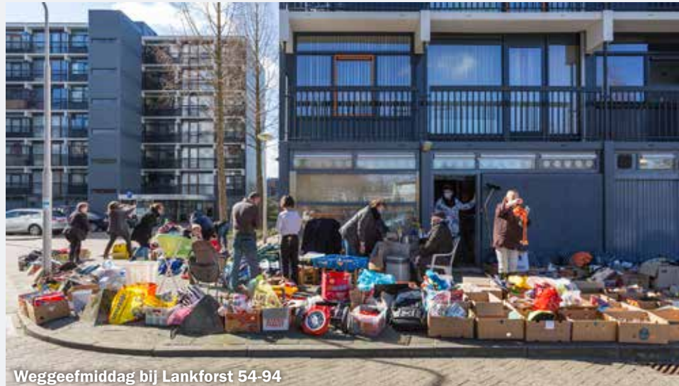
Weggeefmiddag bij Lankforst 54-94

Vele mensen wachten al geruime tijd op ons, hier in Dukenburg. Maar door corona is het nog steeds niet mogelijk op de manier zoals wij zouden willen. Wij vragen nog even geduld te hebben.