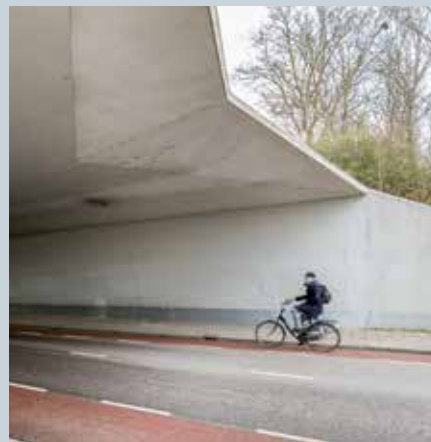
Tunnel onder de Van Boetbergweg

Tekst: Harm Jan van der Veen en Hette Morriën.