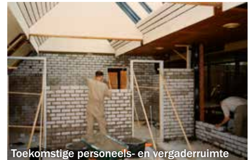
Toekomstige personeels- en vergaderruimte

De andere reden voor het verplaatsen van de horeca was dat met name de groter wordende senioren groepen - geen onbelangrijke groep zwemmers - na de zwemactiviteit de gewoonte had om gezamenlijk een kopje koffie of thee te gebruiken, aangeboden door het zwembad. Doordat de horeca op de begane grond kwam was het makkelijker om bij elkaar te gaan zitten. De veiligheid werd verhoogd omdat het traplopen tot het verleden behoorde.