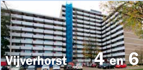
Vijverhorst 4 en 6