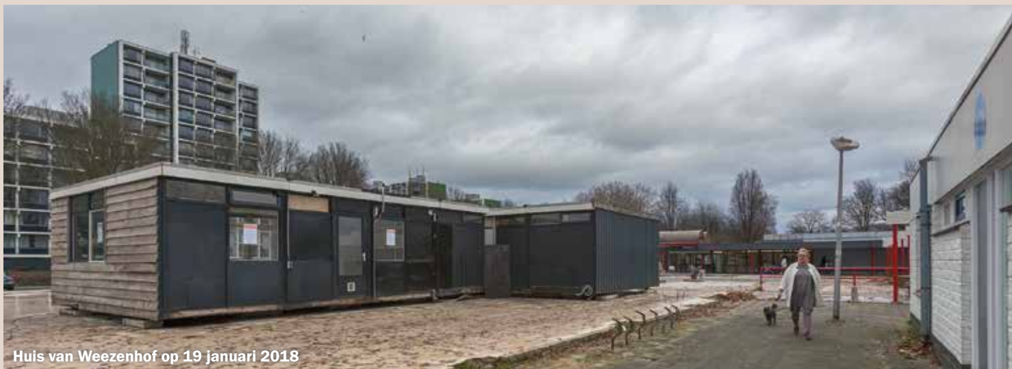
Huis van Weezenhof op 19 januari 2018

In het maartnummer van de Dukenburger stelde ik de vraag over de centrumlocatie Weezenhof: ‘Gaaf er toch wat gebeuren?’ Op donderdag 25 maart besprak de commissie beeldkwaliteit (vroeger bekend als de welstandscommissie) van de gemeente Nijmegen het plan dat door projectontwikkelaar Hendriks ter goedkeuring was ingediend. De commissie stuurde het plan terug naar de tekentafel om nadere invulling te geven aan vragen over de groenvoorziening, de geplande bebouwing, de omvang van het parkeerterrein en de inpassing in de omgeving.