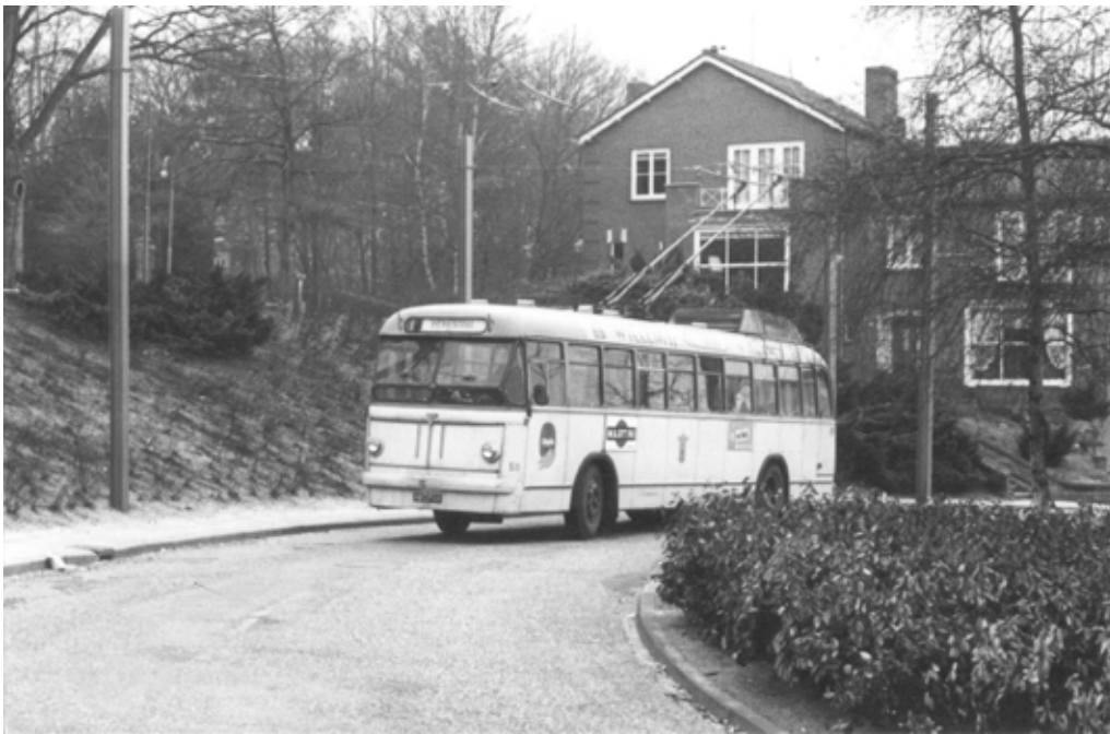
Trolleybus van lijn 1 op de keerlus in Hengstdal. eind jaren 60.

om te vermijden, dat het aanzien van het Keizer Karelplein door masten en draden voor de leiding wordt geschaad. (...)