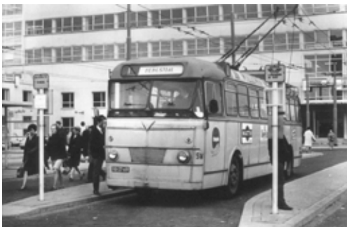
Trolley bij het station. Op de achtergrond het postkantoor. Foto: Fotopersbureau Gelderland, 1968.

De omstandigheid, dat de motoren voor Nijmegen op achthonderd Volt moeten worden geconstrueerd, hetgeen een unicum is, werkt stagnerend op de fabricage, welke bij de English Electric wordt uitgevoerd. Bij nader inzien heeft deze maatschappij gemeend dat de motor welke altijd wordt geprojecteerd en die ook in Arnhem in gebruik is, niet zonder meer geschikt is voor Nijmegen. Er moest een nieuw ontwerp worden gemaakt en dat brengt een vertraging van drie maanden in de aflevering van de motoren te wege. De directeur van het Nijmeegse G.E.B. heeft evenwel maatregelen genomen om dit openthoud teniet te doen. Met spoed wordt in Engeland aan de afwerking van de chassis gewerkt. De Nederlandse firma Verheul, die de carrosserieën