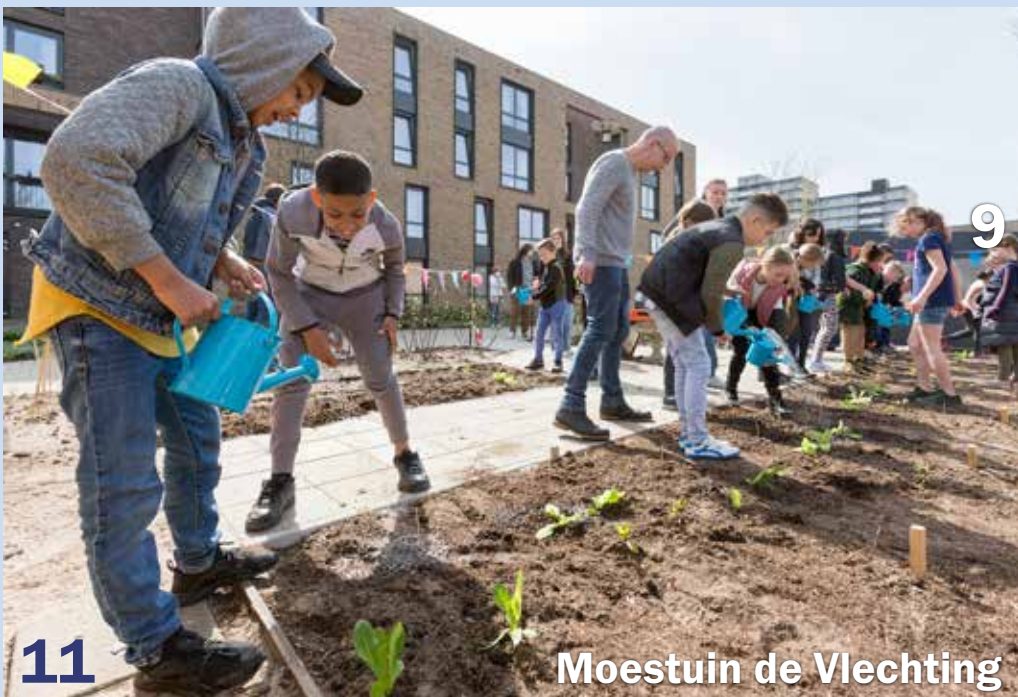
11 Moestuin de Vlechting 9