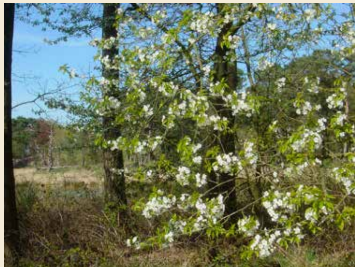
Witte vlek in het landschap

In ons land laat de natuur, het groen buiten, zich vier keer anders zien in een jaar. Anders in elk jaargetijde. In de lente komt het groen uit, in de zomer staat alles in bloei en rijpt, in de herfst sterft alle groen weer af na de rijpe vruchten en in de winter slaapt de natuur. Maar elke lente vindt de groene verrijzenis plaats. Het groen komt dan overal weer massaal terug. Tegelijk met een paradijselijk wit kleed op struiken en bomen.