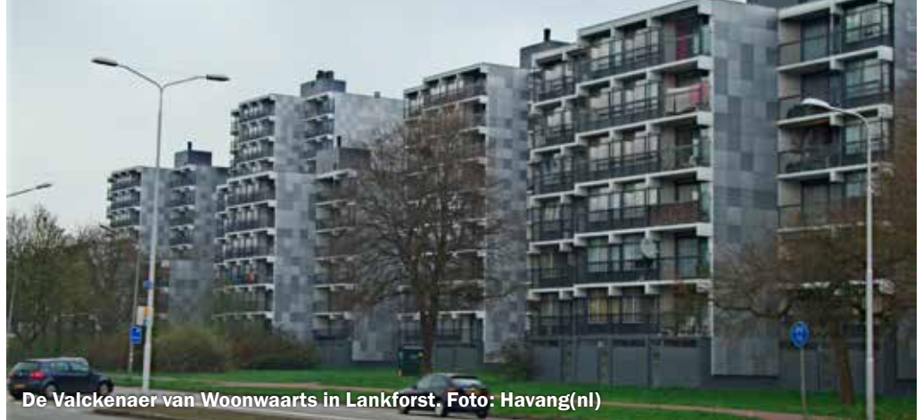
De Valckenaer van Woonwaarts in Lankforst.

niet gehaald werd er een plan zou komen voor alleen noodzakelijk onderhoud, dus geen renovatie, maar daar is geen 70 procent instemming voor nodig.