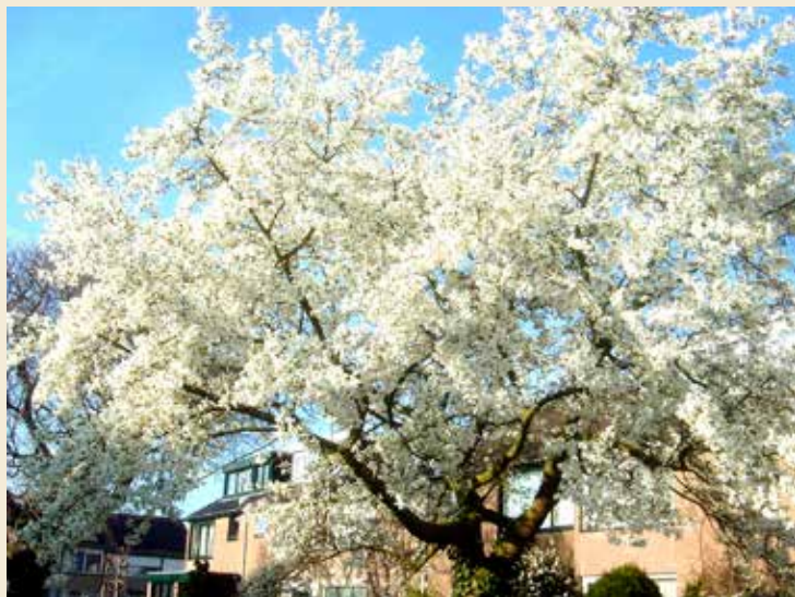
Verblindend wit in Neerbosch