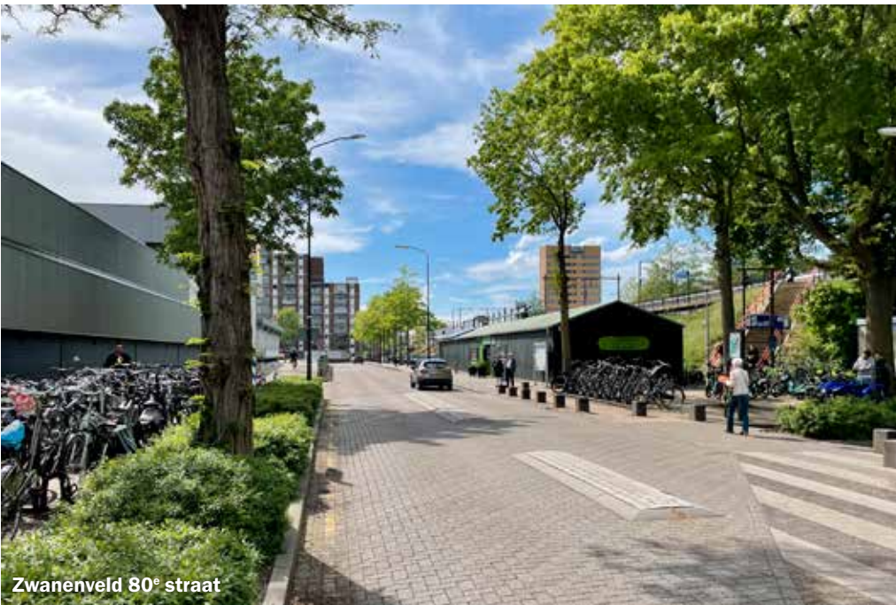
Zwanenveld 80° straat