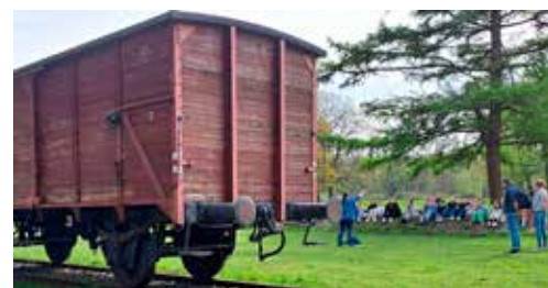
Uitleg van een gids aan een groep scholieren

In het museumgebouw is een film te zien over de bouw van het kamp, het gebruik voor, tijdens en na de Tweede Wereldoorlog. De permanente tentoonstelling laat zien hoe mensen in het kamp kwamen, hoe er geleefd werd, gesport, zelfs getrouwd en dat er cabaretavonden waren. Maar ook hoe de meeste bewoners op een gegeven avond toch dat bericht kregen dat ze de volgende dag 'op reis' gingen. Dat ook hier het Joodse kampbestuur de deportatielijsten samenstelde blijft onvatbaar. Voor elk transport maakte het kampbestuur een transportlijst. Deze lijsten zijn bewaard gebleven. Zo zijn de namen van 107.000 Joden en 245 Roma die uit Nederland gedeporteerd zijn bewaard gebleven. De namen worden de hele