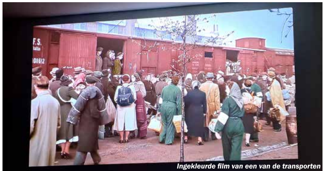
Ingekleurde film van een van de transporten

Indrukwekkend is ook het grote plein waar de 102.000, via Westerbork getransporteerde en vermoorde Joden, 'zichtbaar' zijn gemaakt met grote vakken rechtopstaande blokjes die een Davidster dragen. Hier en daar steekt een portret van een van hen daar bovenuit.