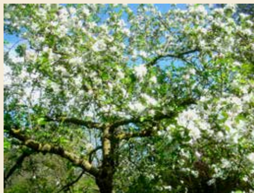
Witte bloesem in de Gofferttuin