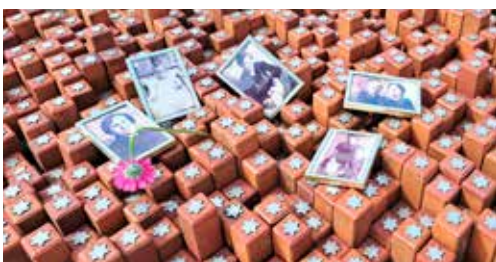
Herdenkingstenen en -portretten

Naast restanten van een van de barakken, die teruggeplaatst is nadat deze jarenlang als schuur bij een boer dienst had gedaan, kom je helemaal achter op het terrein bij het Nationaal Monument Westerbork . Een stuk spoor met omgebogen spoorrails, ontworpen door oud-gevangene Ralph Prins. Het stuk rails rust op 93 bielzen, een aantal gelijk aan de transporten uit Westerbork.