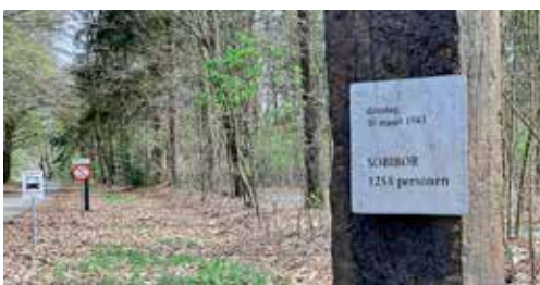
Voor iedere trein een biels

Op het kampterrein aangekomen passeren we