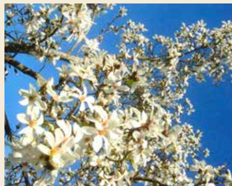
Laat de bijen maar komen

Voor het aanvragen van wandelroutes, groenartikelen of van de catalogus struinbulletin, gebruik je het mailadres: struinbulletin@outlook.com . Ook voor het stellen van vragen of het doorgeven van een boodschap.