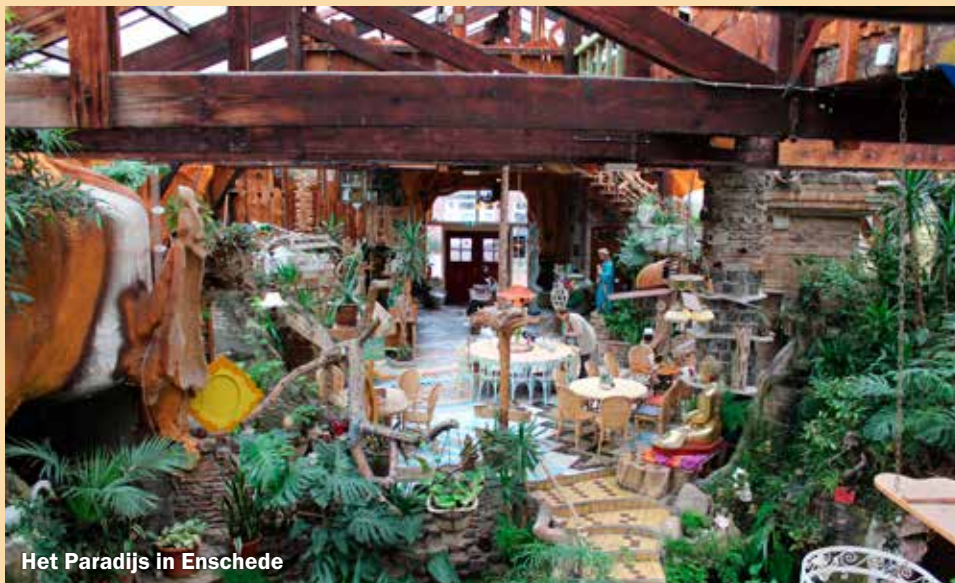
Het Paradijs in Enschede