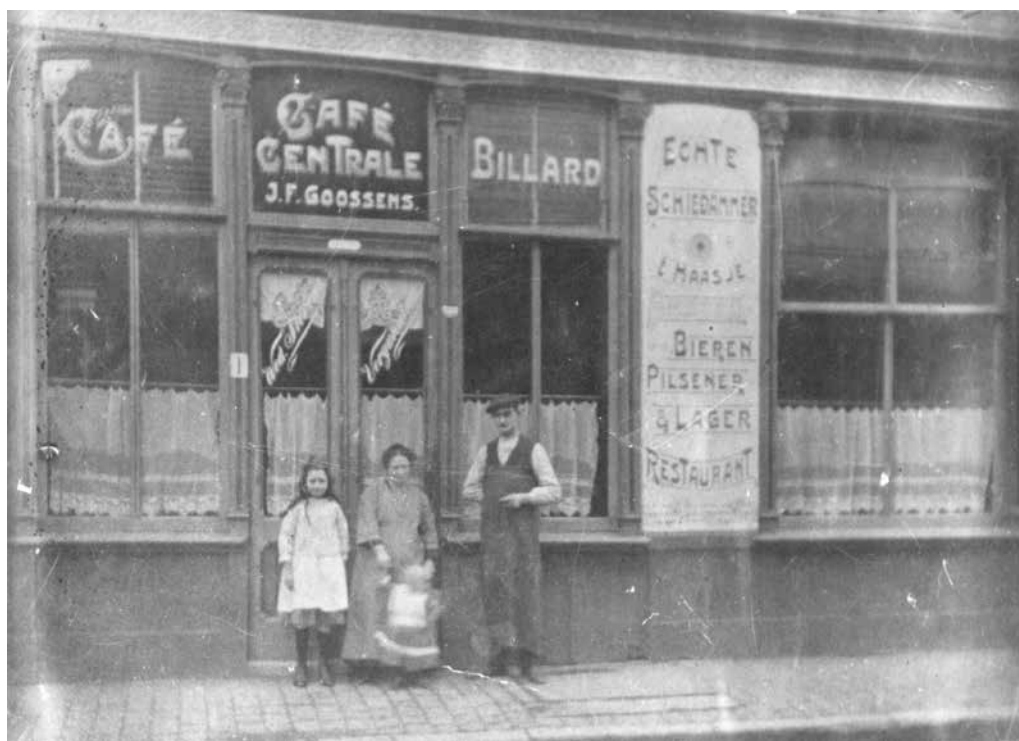
Café Centrale van J.F. Goossens aan de Lage Markt in 1915

Op 17 mei 1889 publiceerde de minister het wetsvoorstel om de situatie van arbeiders te verbeteren. Sinds 1877 moesten arbeiders in Nederlands geld betaald worden. In de grensgebieden werd echter nog vaak in Duitse marken of Belgische franken betaald. Die werden tegen een ongunstige koers omgewisseld. De minister wilde hiertegen optreden. De Werkmansbode vervolgt: