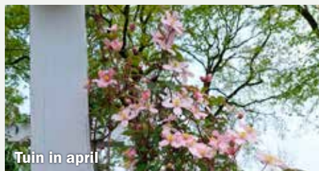
Tuin in april

We hebben behoefte aan meer opslagruimte en ook medewerkers door het jaar of op en rond de Klaasmarkt kunnen we goed gebruiken. Aanmelden kan via klaasmarktdukenburg@gmail.com .