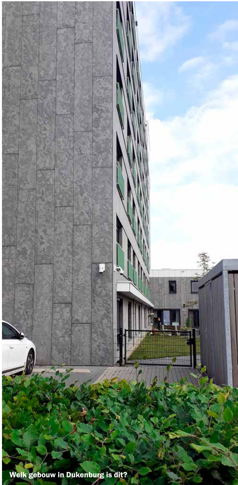
Welk gebouw in Dukenburg is dit?