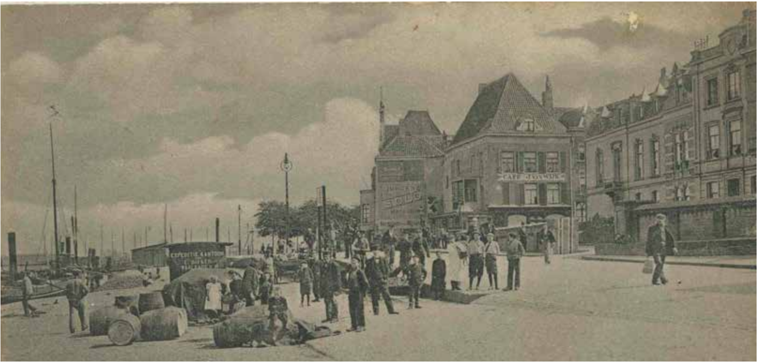
Oostelijke Waalkade in ongeveer 1900. Op de hoek met de Grotestraat café J. van Wijk

dan een kroeg, een „herberg” en hij weet ook dat een bepaalde soort herbergen of drankwinkels daarvoor als aangewezen zijn. Op zich zelf zijn dat zeer gewone en fatsoenlijke huizen, maar die schier uitsluitend van deze klasse van werklieden, of liever van het gebruik en misbruik dat dezen van sterken drank maken, bestaan. Door nu de uitbetaling van het loon in zulke gelegenheden te verbieden, zal het bestaan er van wel is waar niet worden bedreigd, zullen de werklieden even goed blijven drinken, maar de verleiding zal zoo groot niet blijven als zij thans is. Indien de werklieden in een kroeg worden uitbetaald, achten zij zich verplicht ten minste één borrel of één glas bier te koopen, ten minste één; maar hoe dikwijls is die eene de eerste, die de groote trek naar volgende doet ontstaan? Daar komt nog bij, dat de kastelein, bij wie wordt afgekroegd, altijd gaarne borgt aan werklieden in dienst van werkgevers, wier voormannen of bazen hun gelagkamer tot bureau van uitbetaling bestemmen.