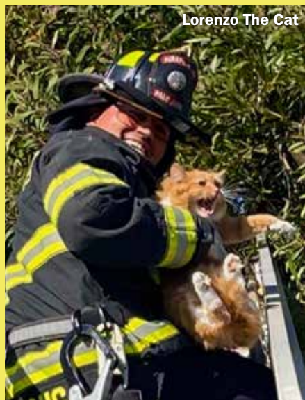
Lorenzo The Cat

Aan de Staddijk klom jaren terug op een winterse zaterdagmiddag een jong katje in een metershoge boom. Aiaiai, poezenbeest had zich lelijk vergist in de hoogte en de ijzige wind. Het diertje zat bibberend te wiebelen op de dunne takjes van de bladerloze woudreus. Alle kracht besteedde het kleine huisdier het weekendlang aan klagelijk miauwen. Zo zielig! Een bewoner kon dit niet meer aanhoren en belde de brandweer. Er waren toen nog geen mobieltjes, toch was de ladderwagen er meteen. Eén robuuste brandweerman klauterde langs de ladder de klagende poes tegemoet. Maar het beestje zocht het hogerop, tot aan de piepkleinste twijgjes toe. Akelig spannend hoor, een poes is immers geen eekhoorn. Niettemin een evenwichtskunstenaar. Toen oom brandweerman het diertje bijna in zijn handschoen kon vangen, besloot de kittenlief gecontroleerd naar beneden te springen om onder de ogen van enkele pensionado's en één brave huisvrouw de poten te nemen richting huis. 'Nou mevrouw', zei het brandweermanvolk grappend, 'uw poesje is gered.' 'Jaja, zo kannie wel weer', dacht de dame #inwendig#, want het katje was de ondeugende huisgenoot van één van de toekijkende mannen. Hij noemde zelfs liefkozend de naam van het avontuurlijke schatje: Farah .