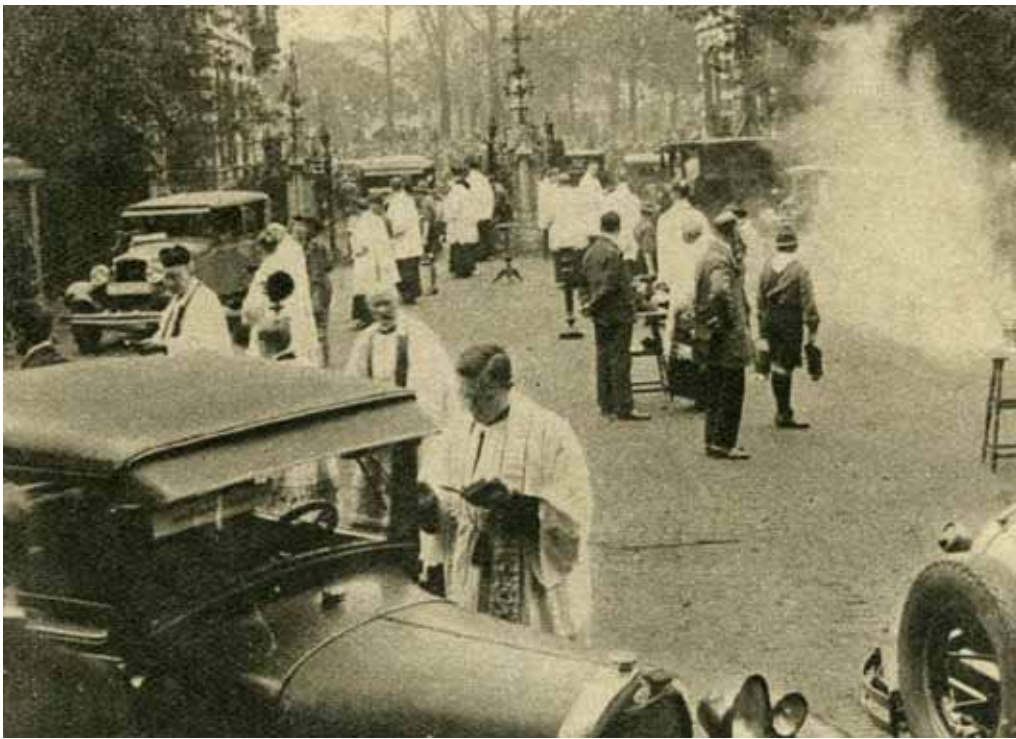
OP HET PLEIN DER ST. JOZEFKERK TE NIJMEGEN heeft Zondag een groote auto-zegening plaats gehad. Ongeveer 700 automobilisten en motorrijders hebben hieraan deelgenomen. Een overzicht van de plechtigheid, welke door duizenden werd gadeslagen.

hoofden, de afdaken der tuinschuurtjes waren met menschen belast. Het was ook niet onaardig te letten op de groote verscheidenheid van de herkomst der auto's. Men zag ze niet alleen uit de omstreken, maar ook uit Noord-Holland, uit Drenthe, uit Groningen. Over het algemeen heerschte er toch een ernstige stemming. Men kon goed merken, dat de autobestuurders zich in den geest met de dienstdoende geestelijken vereenigden.