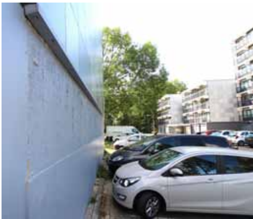
Parkeerplaatsen in Lankforst die weggaan

ook tijdelijke maatregelen, bijvoorbeeld rond slaapkamerramen met ander materiaal definitief aangepast. Deze werkzaamheden, beschreven in de Dukenburger nummer 9-2019, zijn met het uitkomen van deze Dukenburger afgerond. Het complex voldoet weer aan de brandveiligheidsnormen in het bouwbesluit.