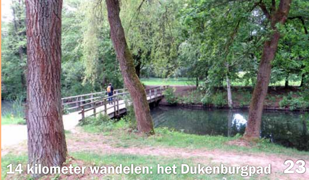
14 kilometer wandelen: het Dukenburgpad 23