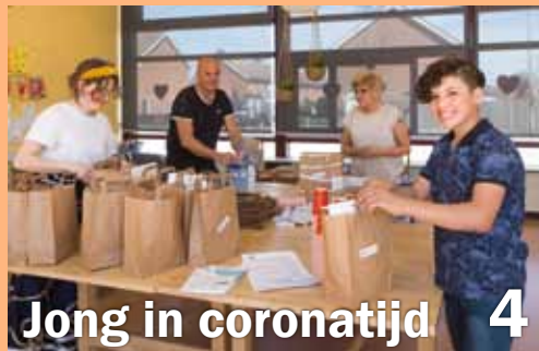
Jong in coronatijd 4