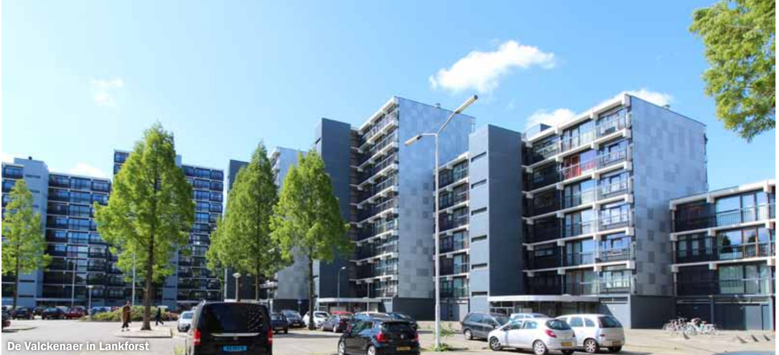
De Valckenaer in Lankforst

Stadspartij DNF hierover vragen in de gemeenteraad en gaat op zoek naar antwoorden. Ondertussen stelt de redactie van de Dukenburger vragen aan diverse woningcorporaties over de isolatie in de complexen die op dat moment gerenoveerd werden of net klaar waren. Van Talis en Portaal krijgen we duidelijke antwoorden over materiaal en de brandklasse van de isolatie in de complexen Boetbergen-Schuijlenburch in Meijhorst en Zwaan en Bloemberg in Zwanenveld. Maar de onzekerheid over andere gebouwen gaat daarna niet weg. Op 18 juli 2019 meldt Zembla wederom dat tientallen gebouwen in Nijmegen onveilig zijn. In de loop van de tijd heeft de gemeente Nijmegen zicht gekregen op welke gebouwen brandgevaarlijk waren, zo wordt aangegeven. Er wordt een lijst (van 63?) opgesteld. Raadsleden belast met deze zaak verwachten deze lijst spoedig in te mogen zien. Helaas, deze raadsleden kwamen bedrogen uit. Raadslid Broeren vertelt het duidelijk in de Gelderlander (8 mei 2020): ‘Deze kwestie speelt al jaren, maar er gebeurt te weinig. De gemeente is misschien geen eigenaar van de flats maar heeft wél een zorgplicht. Bewoners hebben recht op zekerheid.’