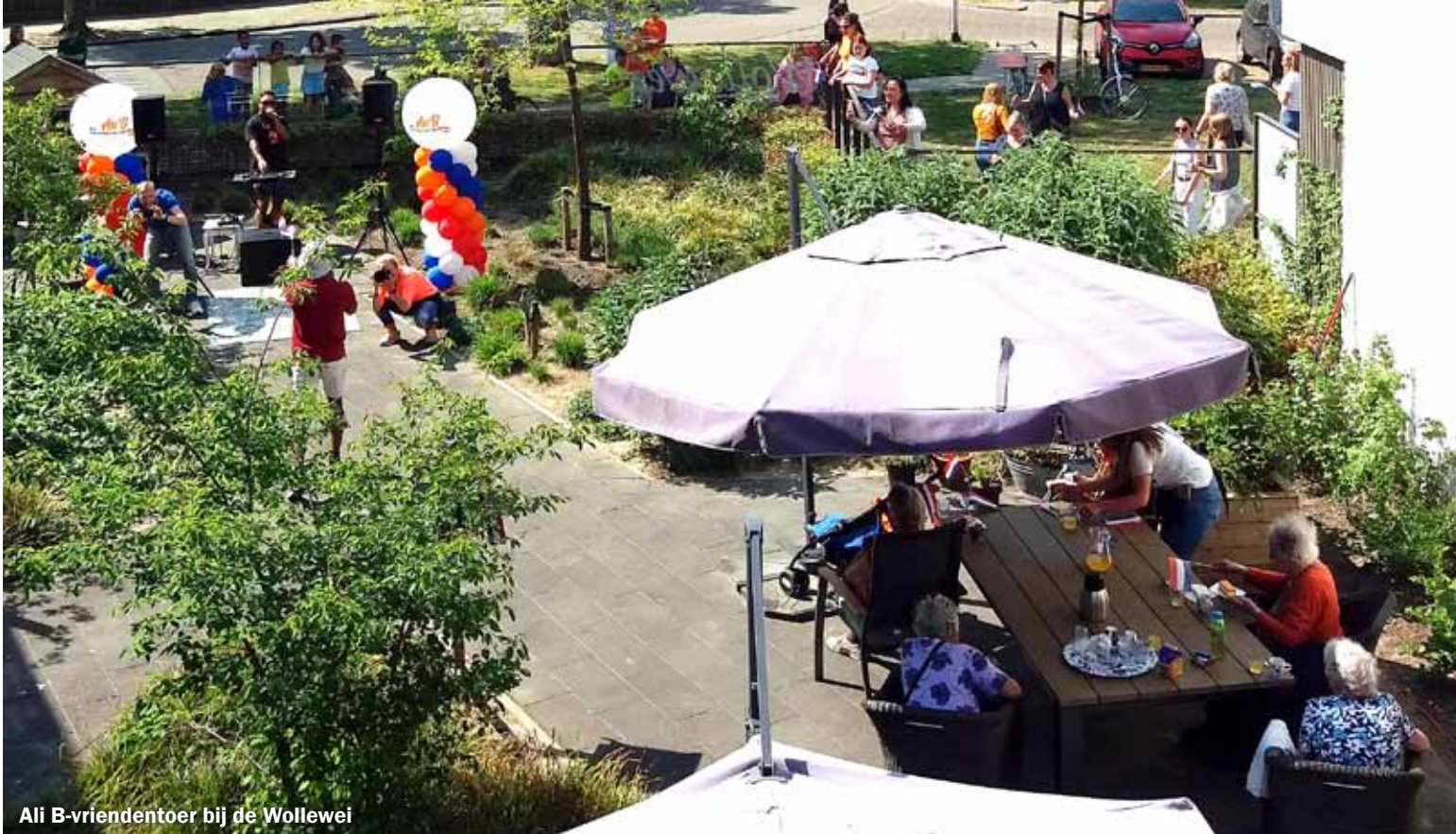
Ali B-vriendentour bij de Wollewei