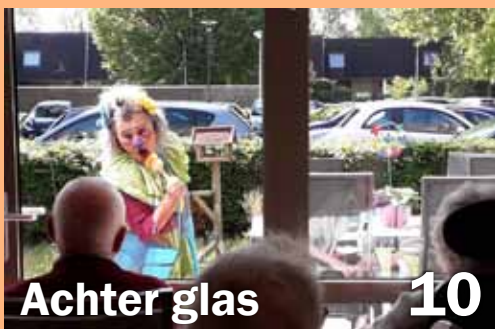
Achter glas 10