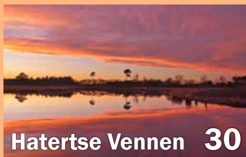
Hatertse Vennen 30