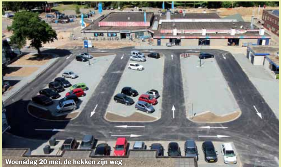
Woensdag 20 mei, de hekken zijn weg

Net voor Hemelvaartsdag kon het parkeerterrein tussen de Albert Heijn en de Meiberg in gebruik genomen worden.