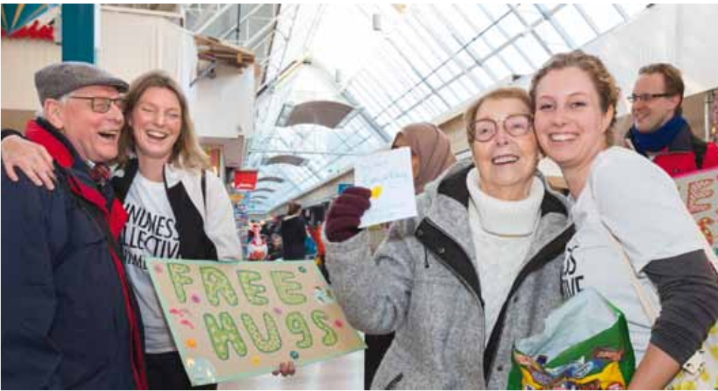
Free Hugs door Kindness Collective Nijmegen in Winkelcentrum Dukenburg op 1 december 2019