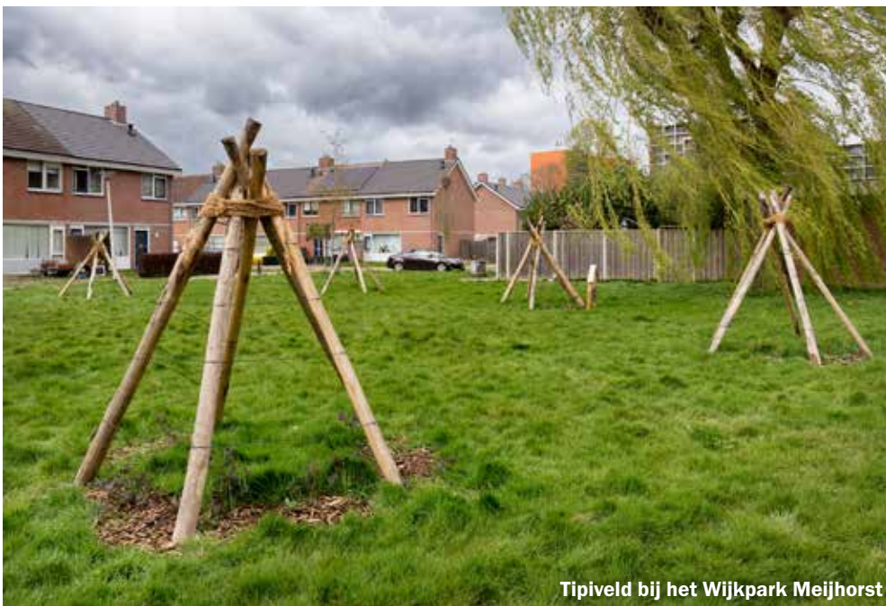
Tipiveld bij het Wijkpark Meijhorst