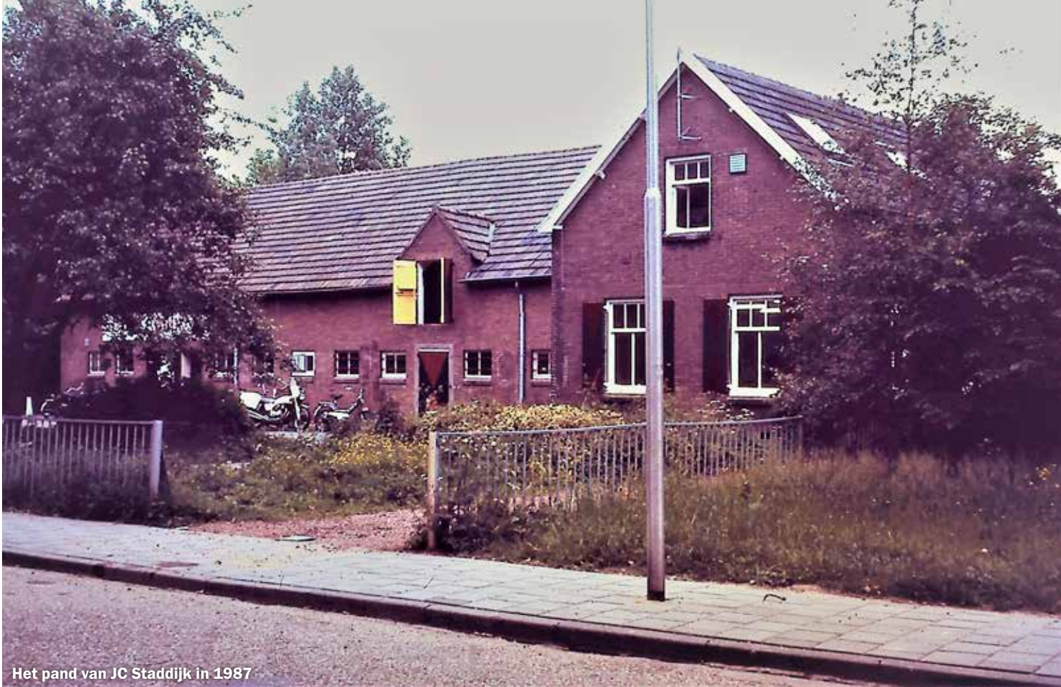
Het pand van JC Staddijk in 1987

moest schulden saneren. Er was een tekort van 20.000 gulden.'