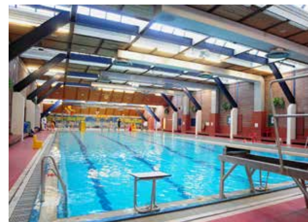
Zwemzaal in 2009

In 2016 kreeg het zwembad in zijn bestaan een derde exploitant. Volgens de gemeente Nijmegen kon het beheer goedkoper en werd de accommodatie ondergebracht bij een stichting. Gelukkig kan ik terugkijken op een periode van gemeentelijke exploitatie en op een periode met Sportfondsen Nijmegen als exploitant. Zeker bij deze laatste periode was het zeer professioneel, klantvriendelijk en niet op de laatste plaats een interessante periode met een leuk team van medewerkers.