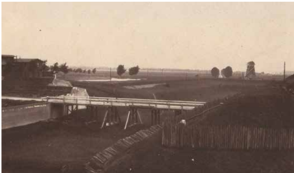
De tweede houten brug buiten de Molenpoort over de droge gracht ter hoogte van het huidige Keizer Karelplein, met links het station van de spoorlijn Nijmegen-Kleef (op de plek van het huidige Concertgebouw de Vereeniging), 1875.

„De goedkeuring van die overeenkomst schijnt daarom vooral aan weinig bedenking onderhevig,