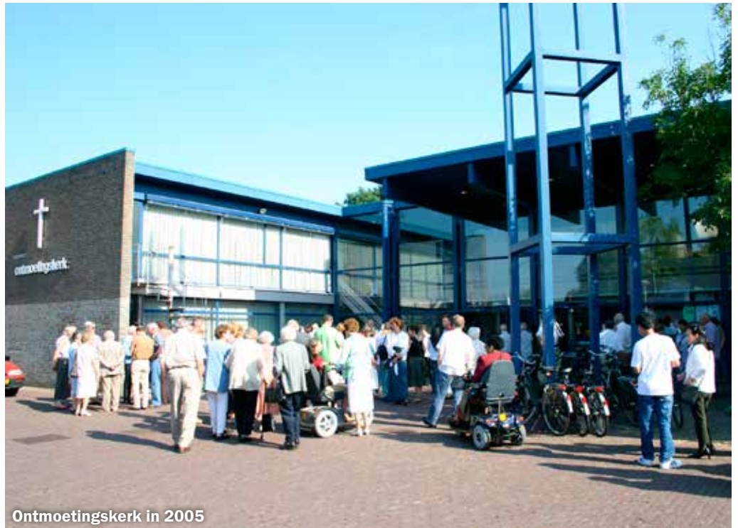
Ontmoetingskerk in 2005

Vooral de jongeren zijn in veel opzichten zeer ernstig de klos geworden. Geen wonder dat zij