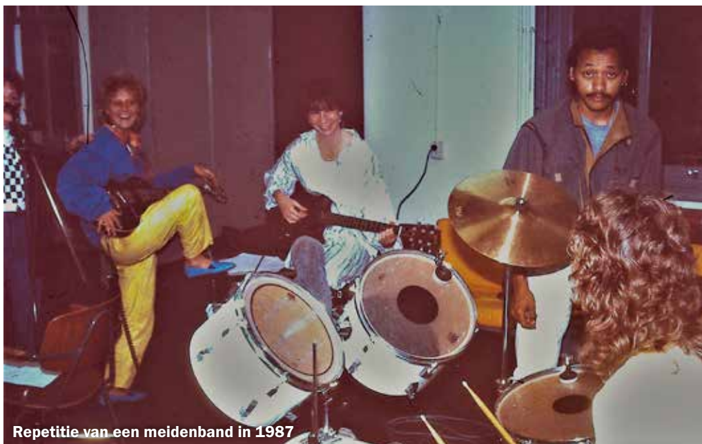
Repetitie van een meidenband in 1987

De activiteiten gingen erg goed, alleen werd er niet goed gelet op de financiën. Ton: ‘Ik