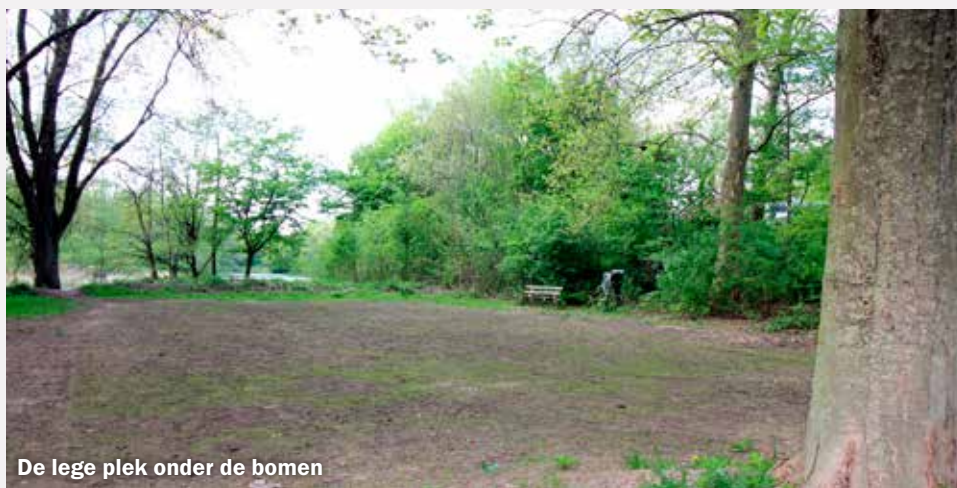
De lege plek onder de bomen

Het kleine voetbalveldje in de Staddijk naast trainingscentrum Michi is nu weggehaald. De metalen doeltjes kregen een nieuwe bestemming en zijn maandag 4 april overgebracht naar Lindenholt.