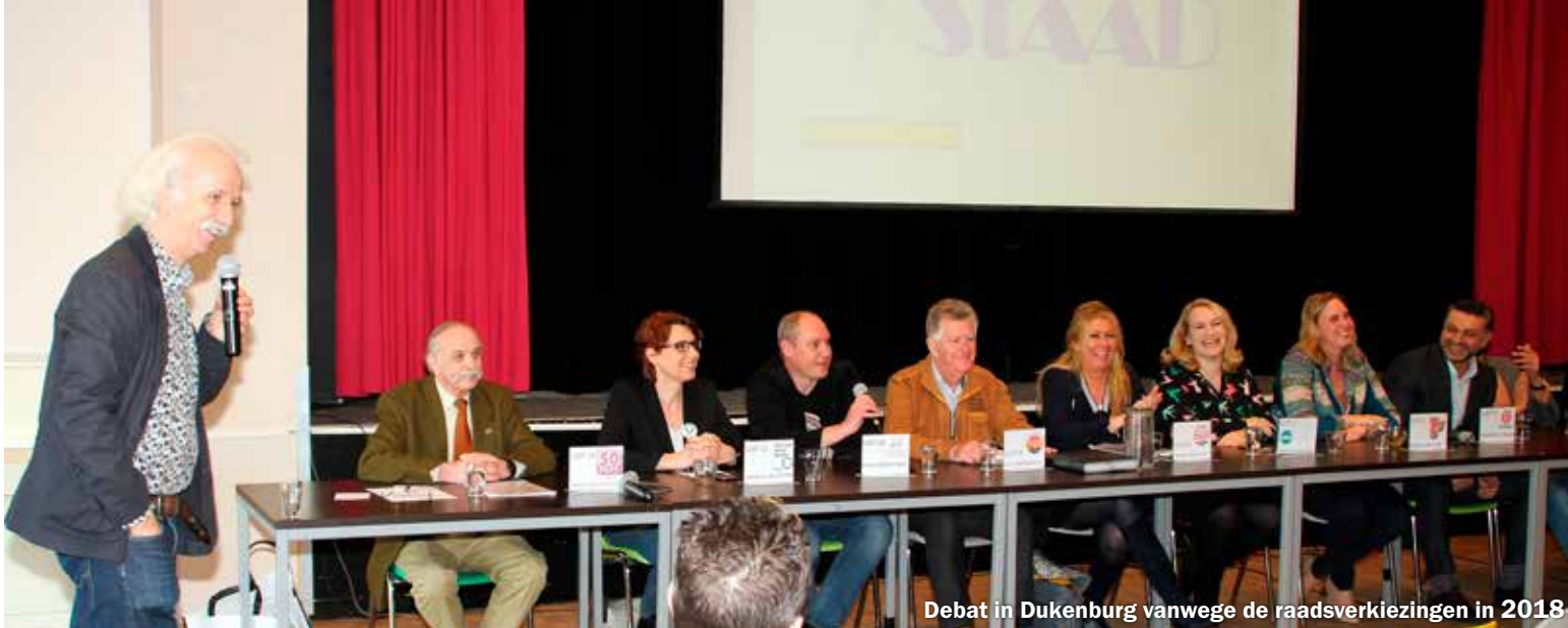
Debat in Dukenburg vanwege de raadsverkiezingen in 2018