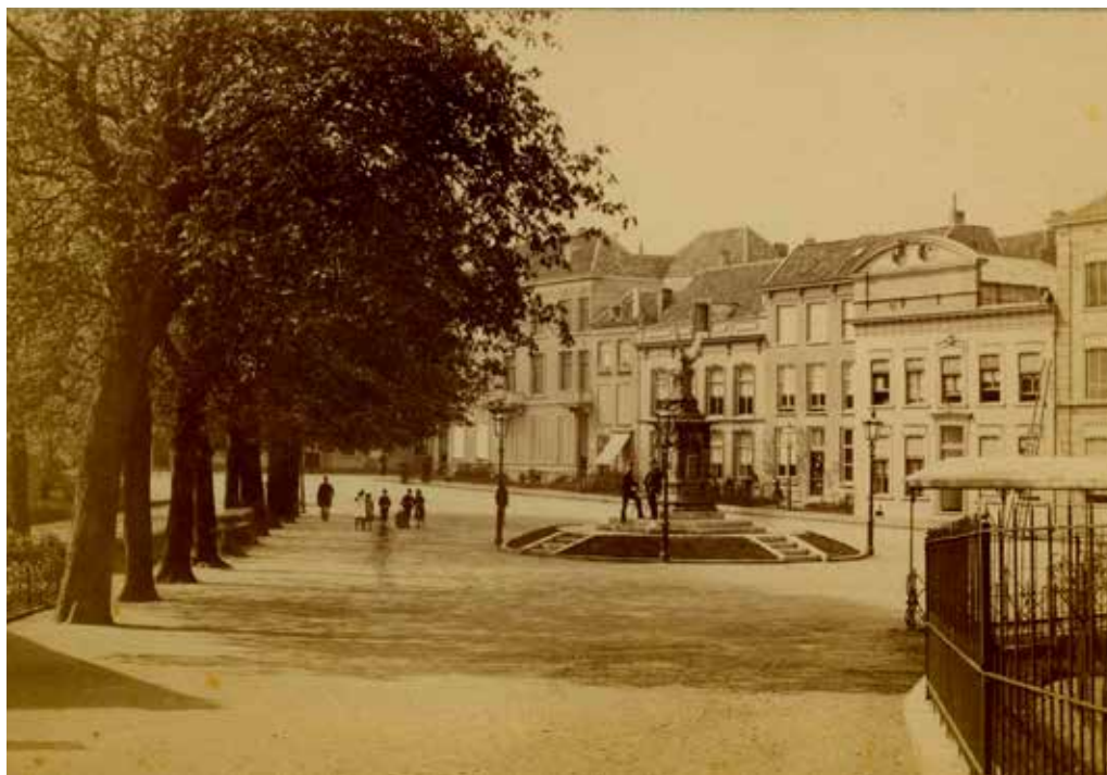
Valkhof met op de achtergrond het Hoogstraatje (nu: Hoogstraat). In het midden het Spoorwegmonument met de beeltenis van de godin Victoria, opgericht in 1884 ter herinnering aan de totstandkoming van de spoorlijn Nijmegen-Kleef, ontworpen door gemeentearchitect ir. Jan Jacob Weve. Ongeveer 1890.