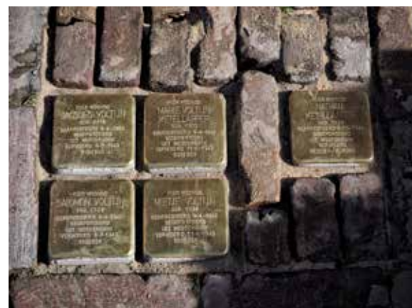
Stikke Hezelstraat 54 (oorspronkelijk 46)

'Een mens is pas vergeten als zijn naam vergeten is.' Gunter sprak deze woorden in 1997 in Berlin-Kreuzberg toen hij de eerste Stolperstein in de openbare straat legde.