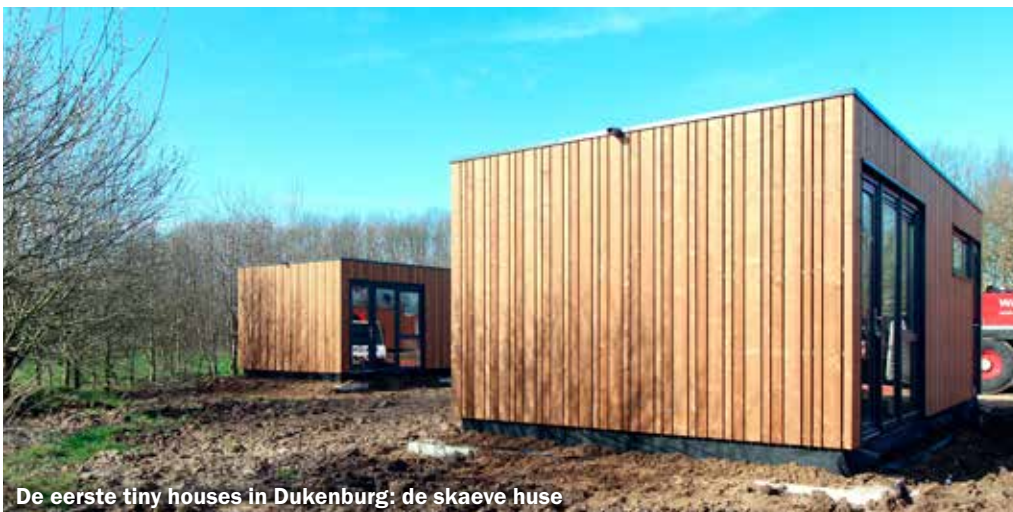
De eerste tiny houses in Dukenburg: de skaeve huse

Vooral de overheid en het bedrijfsleven zijn schuld aan deze digitale verschraling van de samenleving. Banken, verzekeringen, sociale instellingen zijn moeilijk bereikbaar geworden voor een persoonlijk gesprek. In plaats daarvan wordt men voortdurend naar de website verwezen. Op den duur gaan banken zelfs helemaal verdwijnen, zodat men gedwongen wordt alles per internet te regelen. De gemeente is niet veel beter. Door de lockdown heeft men de gewoonte gekregen om via internet