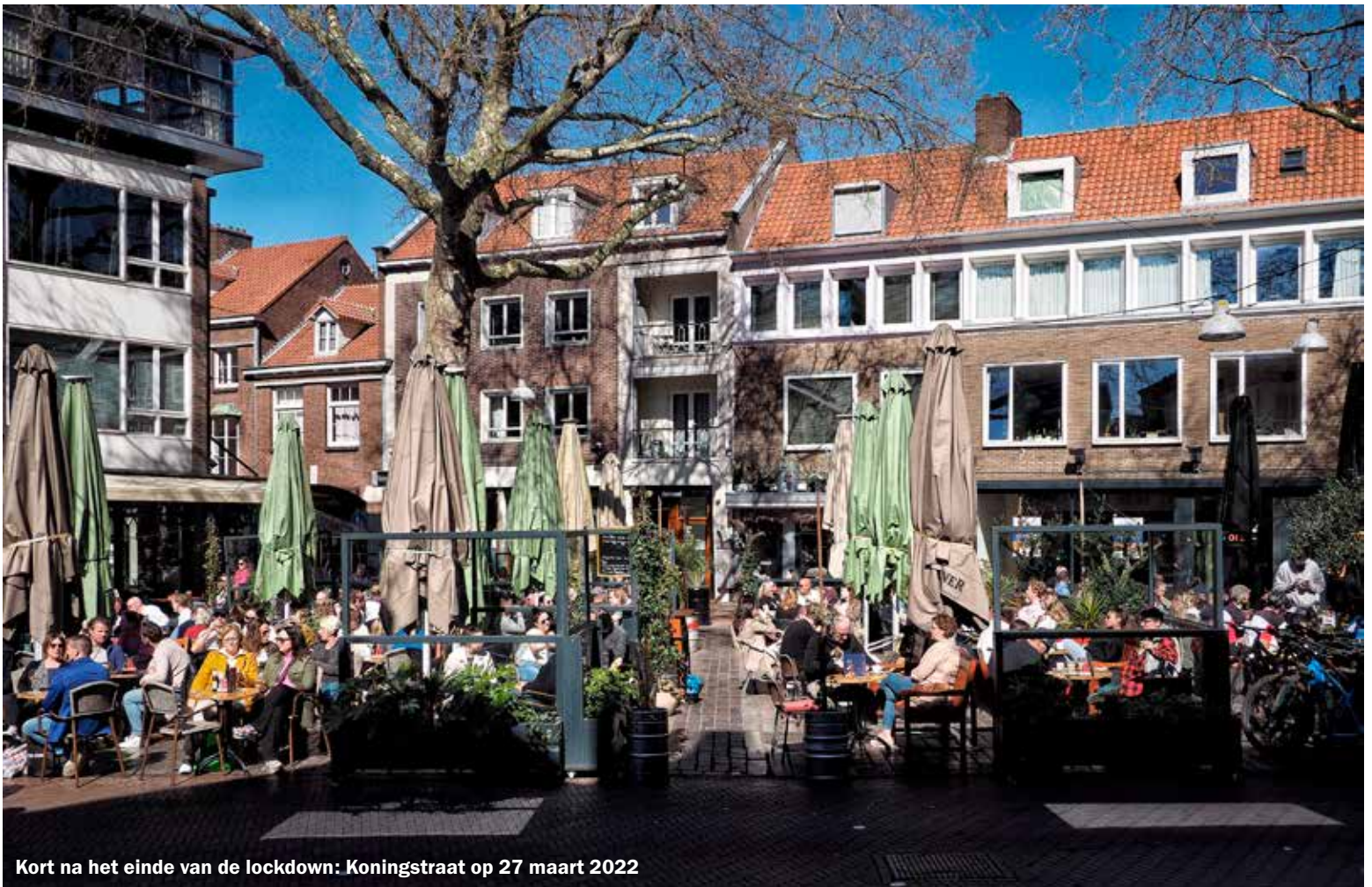
Kort na het einde van de lockdown: Koningstraat op 27 maart 2022

boodschappen te doen en die thuis te laten bezorgen. Verliezers zijn daardoor de MKB'ers. Zelfs sommige cafetaria's sluiten hun deuren vanwege de energiecrisis. Een frietje bij een cafetaria eten wordt bijna een luxe en een haast onbetaalbare versnapering. Corona heeft daardoor veel MKB-bedrijven gesloopt, onder andere doordat zij gewoonweg de service van de groothandel niet kunnen leveren. Toch moedigen we Dukenburgers aan de MKB'ers niet te vergeten. Gevaar dreigt. Geleidelijk ziet men dat men als burger voor zijn dagelijks leven afhankelijk wordt van enkele grootsupers die de markt gaan dicteren en hun positie later gaan uitbuiten.