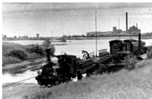
Spoorpont over de Rijn te Welle (Duitsland, spoorlijn Elten-Kleef) met een locomotief uit de serie 500 van de S.S. (later serie 6800 van de N.S.), 1913.

Op woensdag 23 augustus 1865 melden minimal zes Nederlandse kranten, waaronder de Arnhemse Courant :