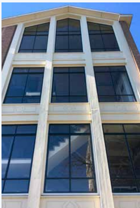
Het Rijks VMBO (gevel Ploegstraat)

We lopen verder door De Kolping, de Landbouwuurt en Muntenbuurt en genieten van het lijnenspel van industriële bouw en een schoolcomplex.