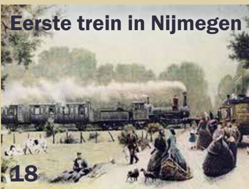
Eerste trein in Nijmegen