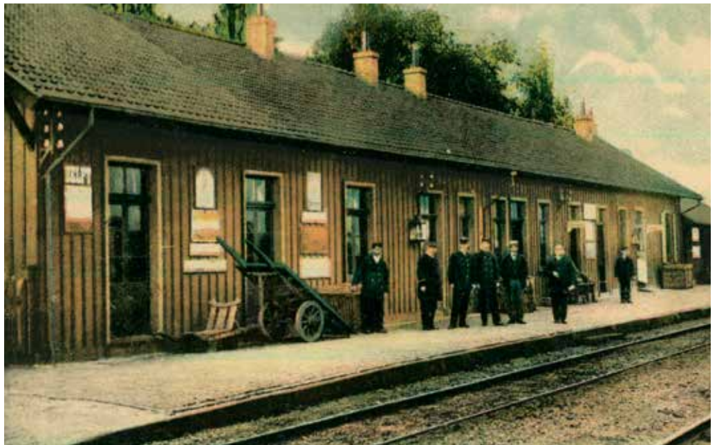
Station Groesbeek met spoorwegpersoneel, gelegen aan de spoorlijn naar Kleef, 1906.

De baan is hare voltooiing nabij geraakt. Ingenieurs van den waterstaat hebben bij herhaling aan directeuren en in hunne rapporten aan het ministerie hunne tevredenheid over het werk betuigd. De kosten der baan zijn nog niet juist op te geven, doch in geen geval zal het bedrag de geraamde kosten overschrijden. Men komt voldoende met het geld uit, dit kan de directie met zekerheid mededeelen. — Omtrent de aansluitingslijnen kan de directie van het slagen der lijn Nijmegen — 's Bosch niets zeggen, terwijl zij die hooge wenschelijkheid betoogt der onlangs geprojecteerde lijn Dordrecht—Arnhem—Nijmegen. Met de grootste voldoening kan de directie mededeelen, dat de lijn Nijmegen—Cleve binnen 9 maanden, nadat de eerste spade in den grond is gestoken, gereed zal zijn. Immers het voornemen bestaat, om op 11 augustus aanstaande de baan voor het publiek te openen. Op 10 augustus zal een feestrid naar Cleve plaats hebben voor