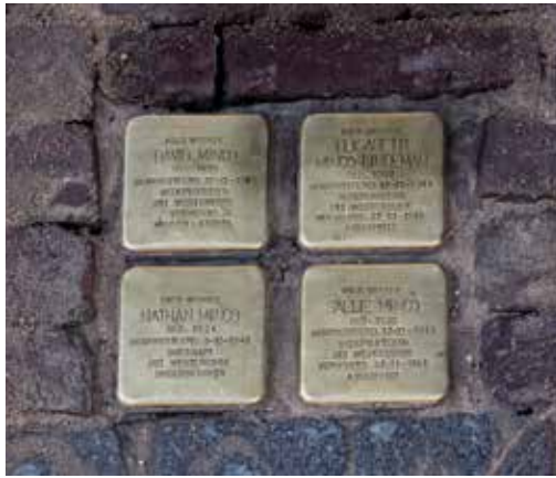
Lange Hezelstraat 41