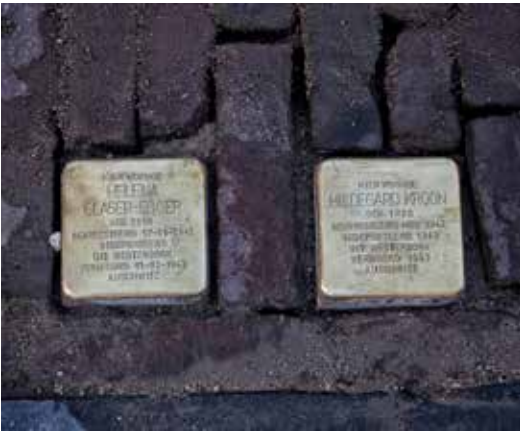
Stikke Hezelstraat 93 (oorspronkelijk 41)