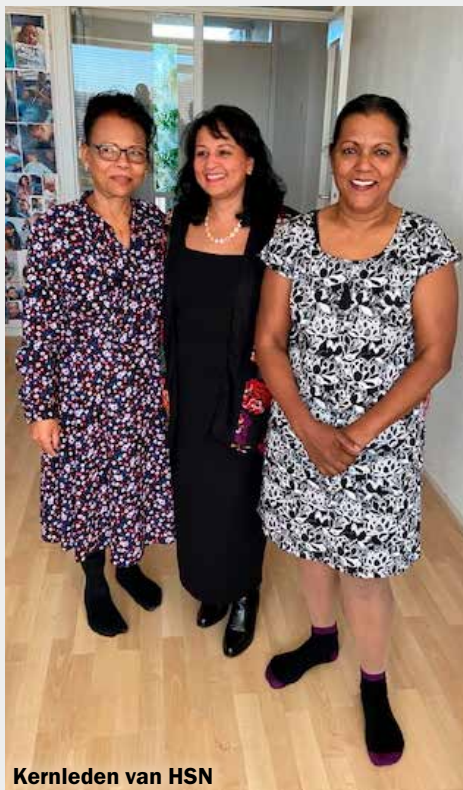
Kernleden van HSN

De volgende activiteit is op donderdag 16 juni van 13.00 tot 16.00 uur in Wijkcentrum Dukenburg, Meijhorst 70-39.