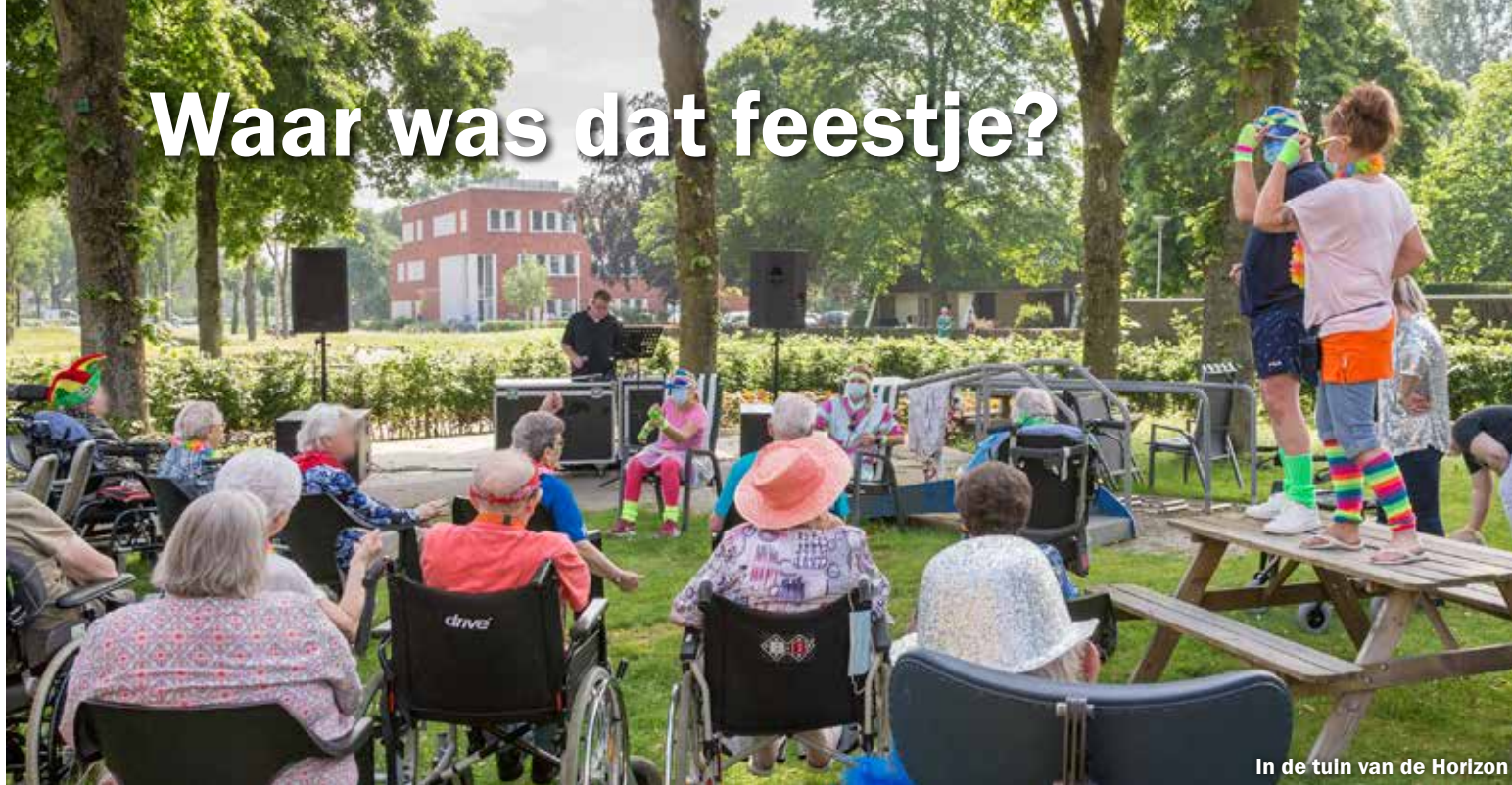
In de tuin van de Horizon

Wie vierden dat feestje? Welk feestje en waarom? Wannéér was het feest en waar dan toch? Lees vooral verder en beleef de voorjaars happening op vrijdagochtend 4 juni mee.