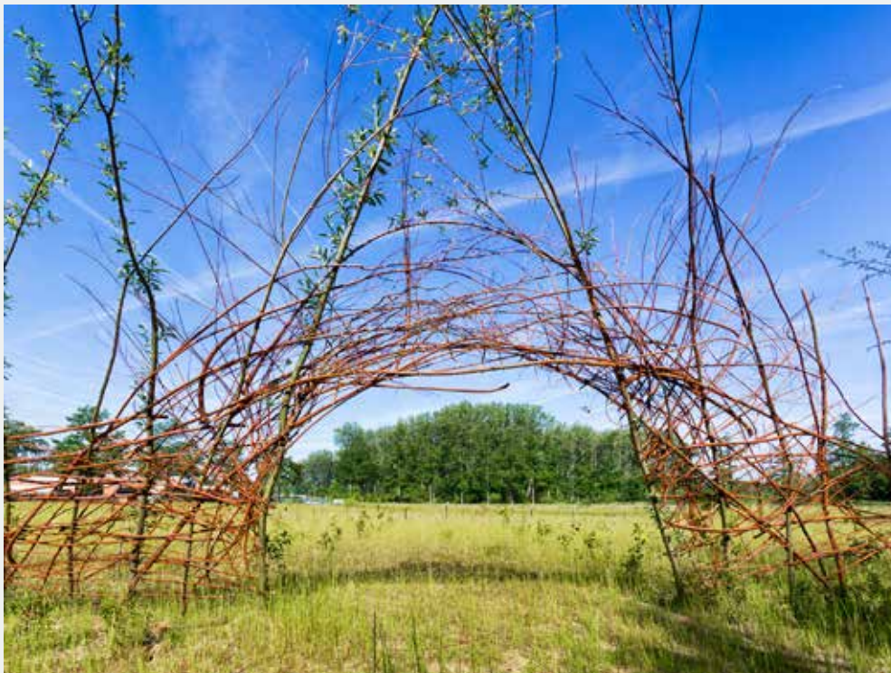
Hier aan de Streekweg komen de Stadsnomaden. Er is al een natuurlijke omheining gemaakt

Tekst en foto boven: Toine van Bergen Foto onder: Jacqueline van den Boom