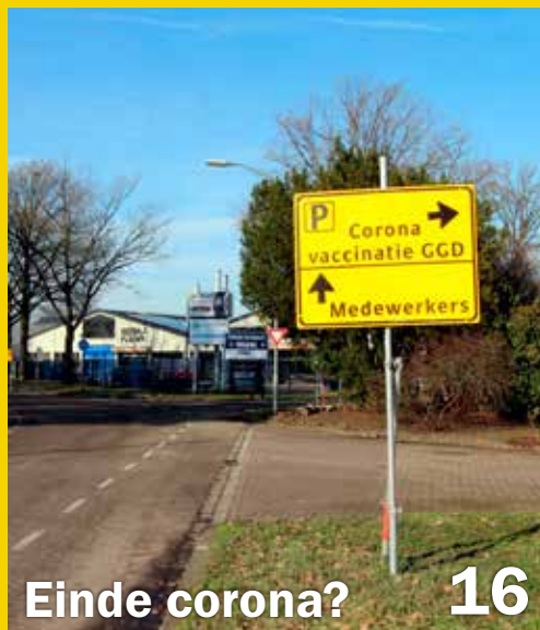
Einde corona? 16