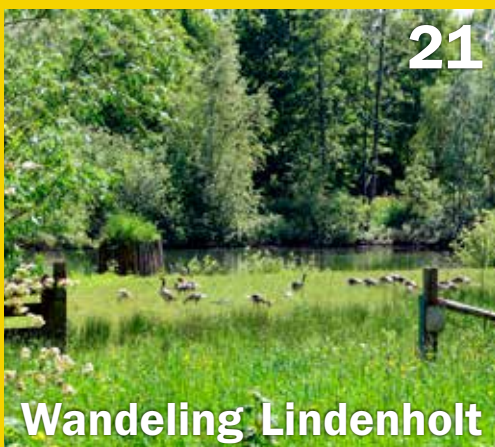
Wandeling Lindenholt 21