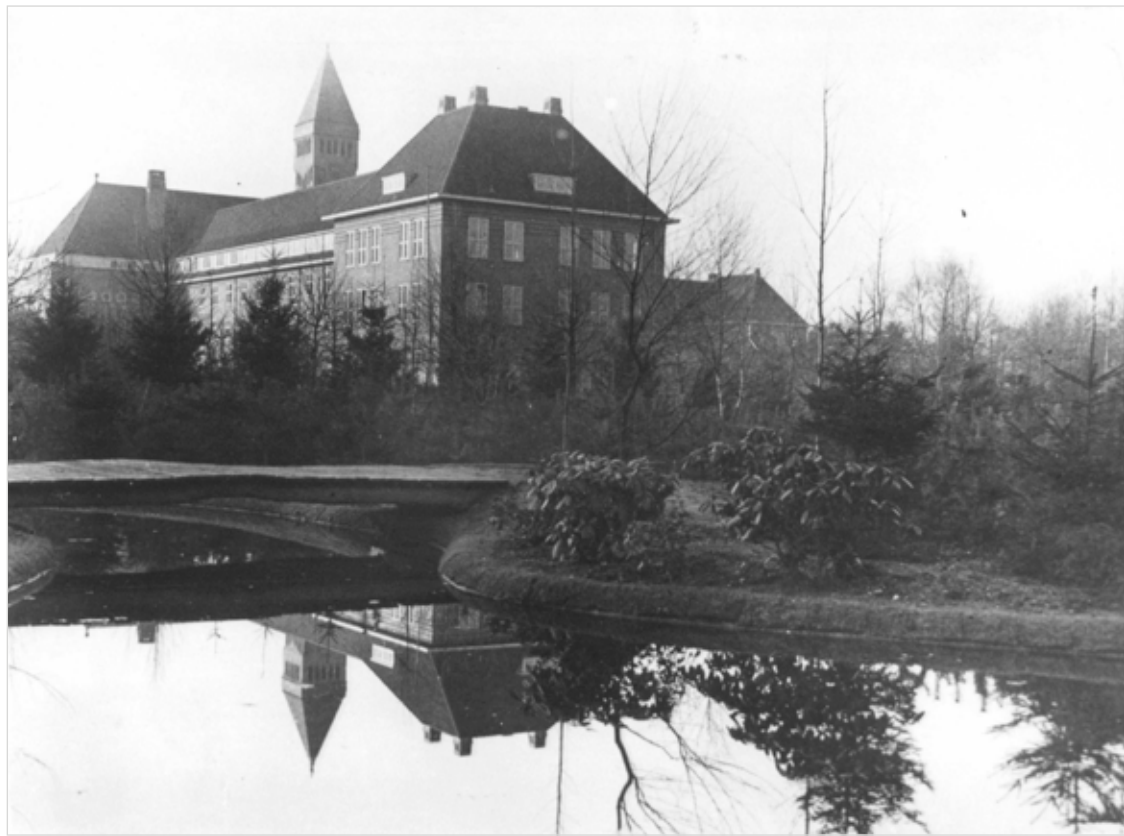
Klooster Berchmanianum van de Jezuiten aan de Houtlaan, circa 1935