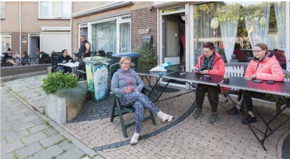
Aan het begin van de coronacrisis: voortuinbingo in Zwanenveld 40'er straten op 24 april 2020

demiegolf. Dit soort sociaalpsychologische gedragingen zijn meestal een teken van uitputting en frustratie. De stress is dan ook vooral onder de jongeren vrij heftig en hun gedragingen zijn nauwelijks in de hand te houden.