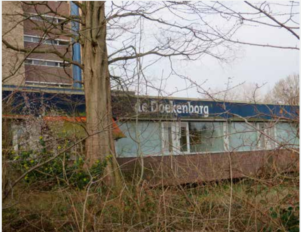
De Doekenborg wordt gesloopt. Op die plek moeten seniorenwoningen komen

Veel aandacht is er ook voor woningbouwplannen in de Kanaalzone. Deze zijn in het conceptplan dat er nu ligt nog niet uitgewerkt. Op de locatie de Hippe Kip (hoek Streekweg/Van Rosenburgweg) gebeurt voorlopig nog weinig. Garagebedrijven zouden daarnaast verhuizen vanuit Winkelsteeg, waar meer woningen moeten komen. Maar de grond is op dit moment nog geen eigendom van de gemeente en gesprekken met de bedrijven lopen nog.