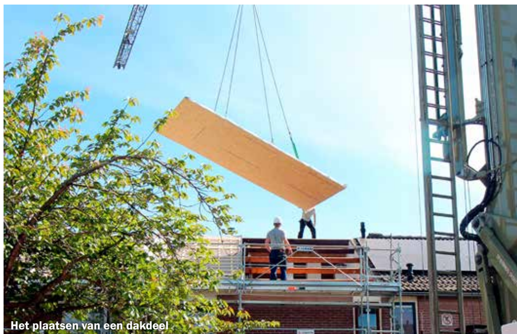
Het plaatsen van een dakdeel

‘We hebben de zolder moeten leeghalen. We wonen 44 jaar in Aldenhof. Dus je kan je voorstellen wat dat betekent’, vertelt Theo. ‘Ik ben op die zolder dertig jaar bezig geweest met mijn grote hobby: het bouwen van een modelspoorbaan. Deze modelbaan in spoor H0 moest helemaal worden afgebroken. Ik ben begonnen met de bouw toen mijn dochter, die in de Verenigde Staten woont, specifieke Amerikaanse spoormodellen en accessoires opstuurde. Bij