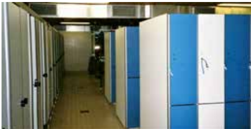
Nieuwe lockers rechts

Het stond al langere tijd vast de garderobe te moderniseren. Dit had twee redenen, namelijk de toenmalige wisselcabines met lockers waren verouderd - geplaatst tijdens de bouw in 1978 - en het toegenomen bezoek door senioren. Inmiddels was de renovatie klaar en werd de garderobe aangepakt. De sombere donkerbruine cabines en dito lockers werden vervangen door cabines uitgevoerd in fris wit en lockers in blauw met wit. De garderobe was hierdoor voorzien van moderne kleedcabines. Omdat de bezoeker, met name de oudere, behoefte had aan meer ruimte tijdens het omkleden, waren enkele cabines groter van afmeting. Omdat niet alle cabines groter waren, gebeurde het nogal eens dat men het hokje zag als 'privé'-bezit en kleding erin liet hangen, waardoor het niet gebruikt kon worden door de volgende bezoeker. Met het vernieuwen van de garderobe was de verbouwing, die eerder had plaatsgevonden, nu afgerond.