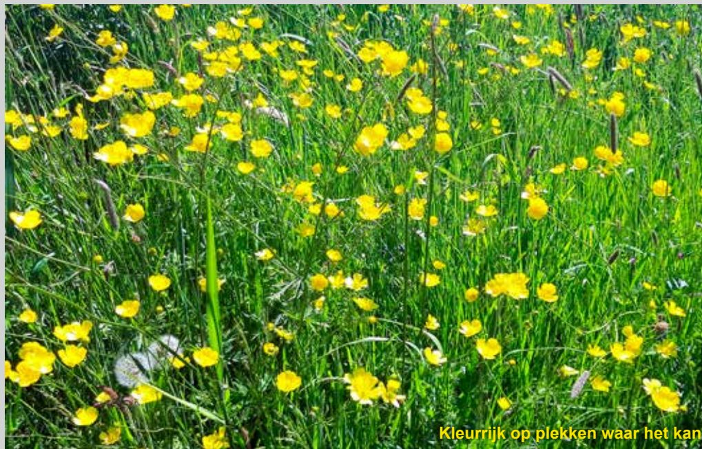
Kleurrijk op plekken waar het kan

Ook rond de speelplekken van kinderrijke gebieden is het ronduit een ramp. Het lange gras blijft langer nat, een balspel is haast onmogelijk en vooral, ja vooral de grotere hoeveelheden hondenpoep. Het hoge onkruid is kennelijk een vrijbrief voor hondenbezitters om hun