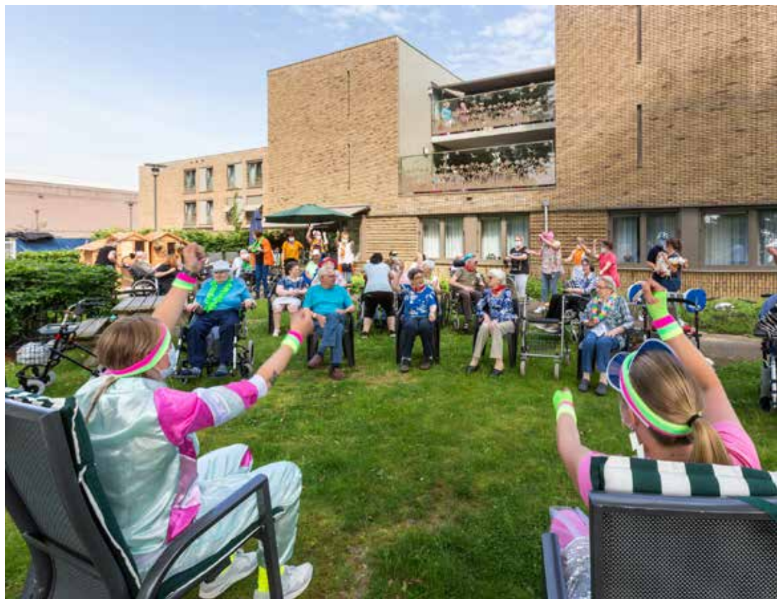
Het land komt weer een beetje los: feestje in de tuin van de Horizon in Meijhorst op 4 juni 2021

De ervaring bij de Spaanse griep uit het verleden leert dat veel mensen op den duur de opgelegde beperkingen zat worden. Genoeg is genoeg is dan de slogan. Ze nemen de pandemie voor lief omdat zij het oude leven weer willen opnemen. Deze instelling leidt onvermijdelijk tot meer zieken en een verlenging van de pan-