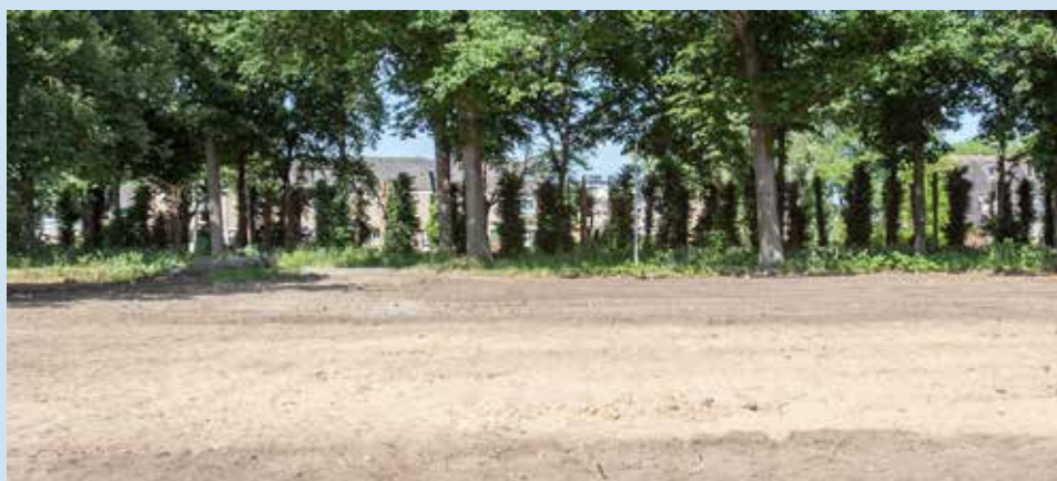
Boven: het terrein langs het Maas-Waalkanaal tijdens het interview met boswachter Tim Hogenbosch op 14 januari 2021. Onder: hetzelfde terrein op 11 juni 2021

Sinds enkele weken kijk ik vanuit mijn appartement uit op een grote kale zandvlakte. Dat betreft een brede strook grond aan de Oude Dukenburgseweg en parallel aan het Maas-Waalkanaal.