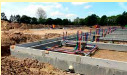
De voorgemonteerde leidingen steken kleurrijk omhoog

De afgelopen weken stond het werk op het voormalig HAN-bouwterrein niet stil. Eind mei was de zesde verdieping van het appartementengebouw bereikt.