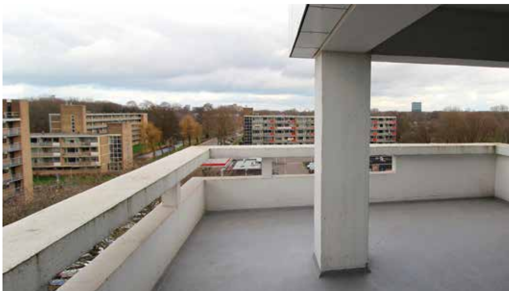
Op elke verdieping is een hoekwoning met groot balkon

Tekst: Hette Morriën.