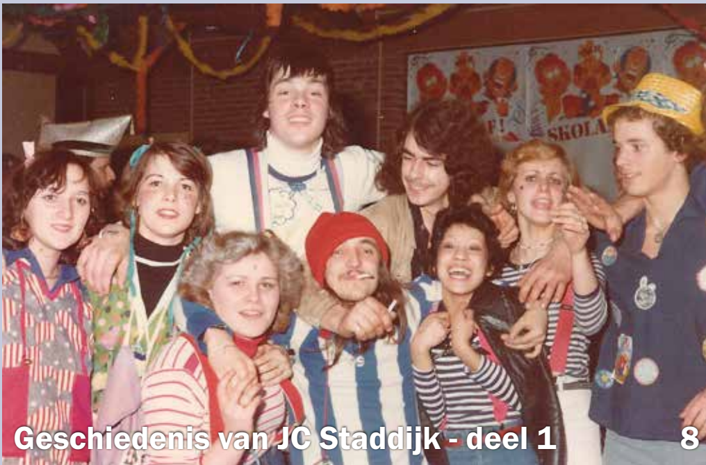
Geschiedenis van JC Staddijk - deel 1