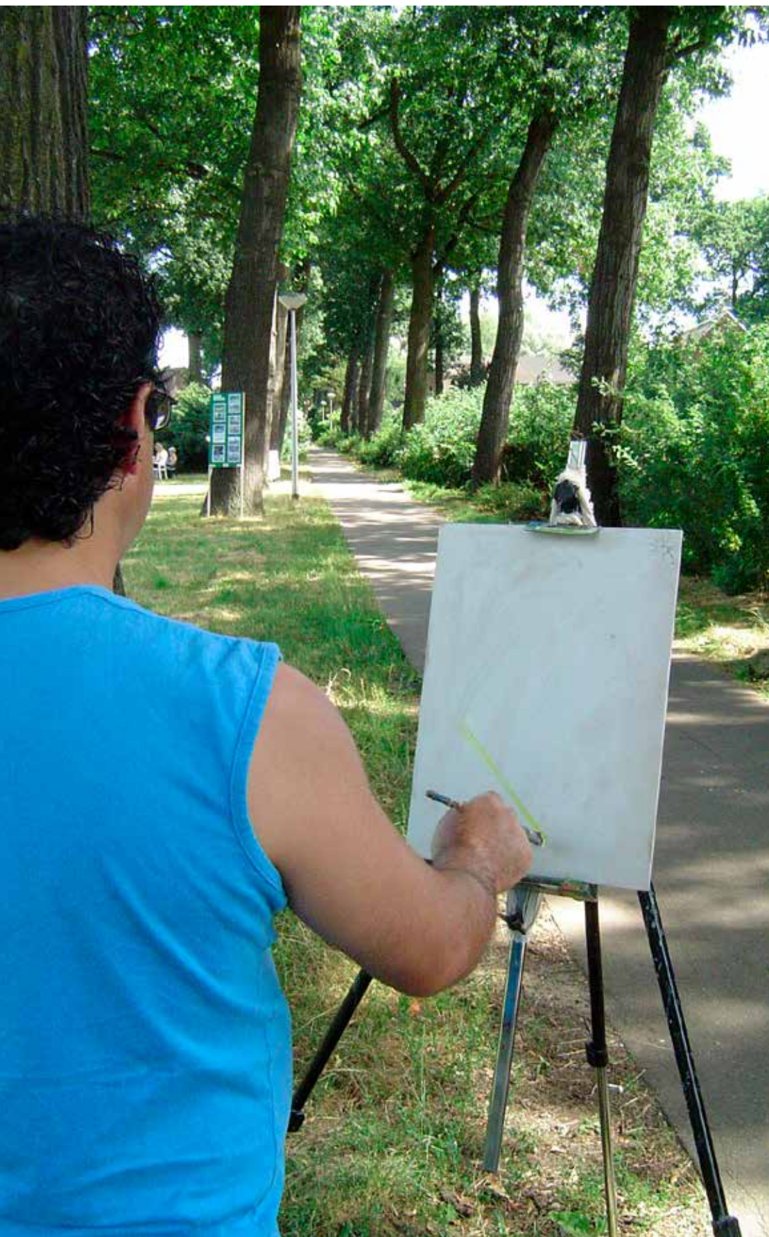
2006: het Zegerspad tijdens de schilderdag, viering 400 jaar Rembrandt

Centraal in Meijhorst ligt het Zegerspad, de historische eikenlaan van het voormalige landgoed Duckenburg die in maart 2016 op initiatief van bewoners een naam kreeg.