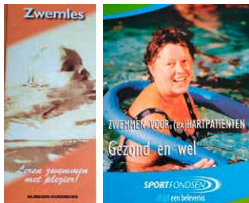
Voorbeelden van folders

Inmiddels konden kinderen vanaf vier jaar elke dag terecht voor zwemles. Ook voor andere doelgroepen, zoals volwassenen, (ex-) hartpatiënten en allochtone vrouwen, was het mogelijk zwemles te krijgen.