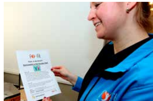
De flyer voor gymnastiek is al klaar voor de nieuwe bewoners