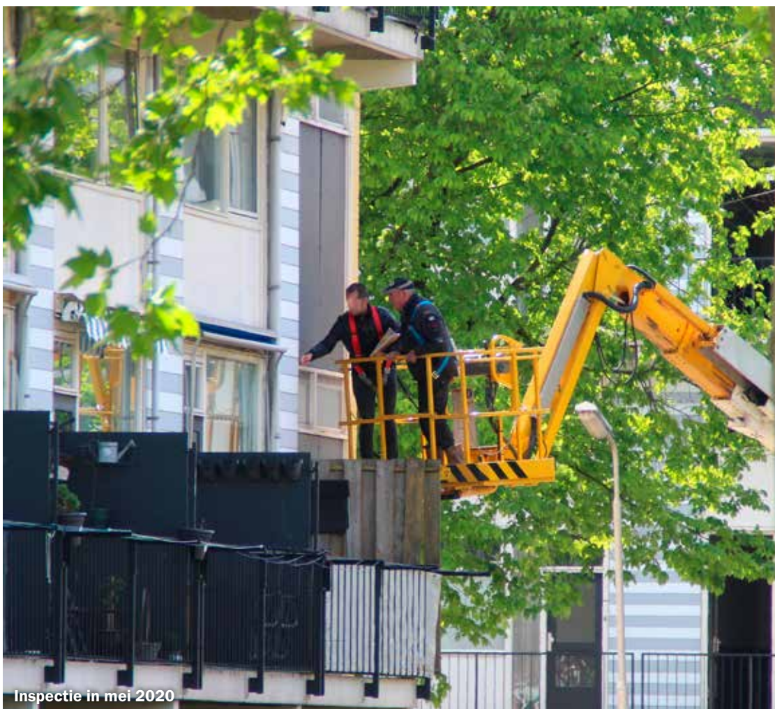
Inspectie in mei 2020

‘Half januari gingen wij met acht bewoners van de maisonnettes in de Meijhorst in gesprek. De aanleiding voor het gesprek was een brief met klachten over de woningen en de woonomgeving die wij vorig jaar ontvingen. Deze bewoners is er veel aan gelegen om prettig te wonen. Wij hebben waardevolle inbreng gekregen over deze woningen. We bespraken vragen over schimmelvorming, tocht, natte ramen, lekkages en onaantrekkelijke trappenhuisen. We hebben de klachten bij een aantal woningen bekeken. Dit inzicht in de klachten gebruiken wij bij het onderhoud’, aldus de Talisbrief.