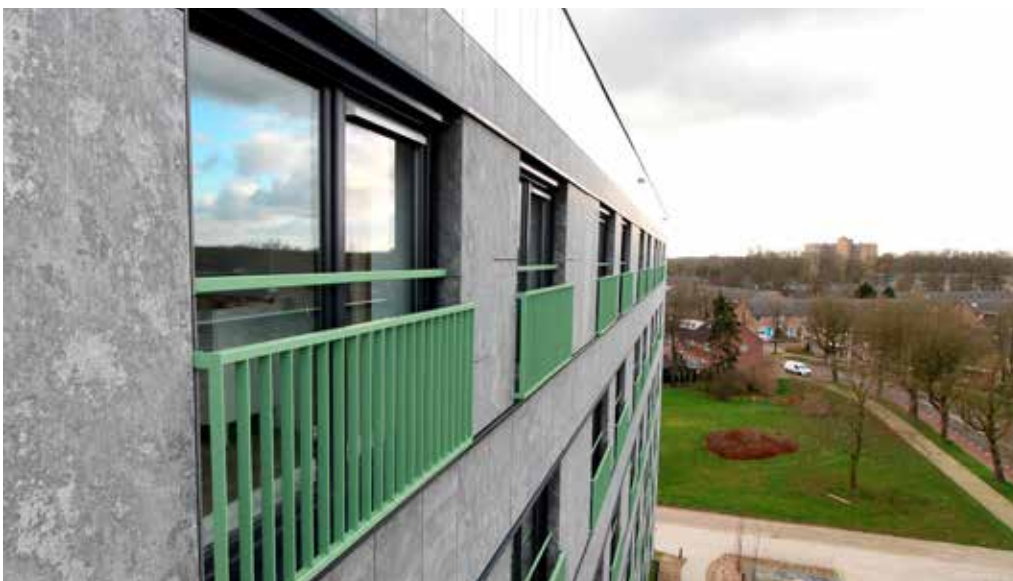
Vanaf bovenste verdieping mooi zicht op Dukenburg