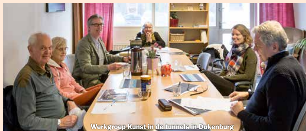
Werkgroep Kunst in de tunnels in Dukenburg

nomen twee viaducten in ons stadsdeel van kleurige wandschildering te voorzien, wat meer stappen gezet.