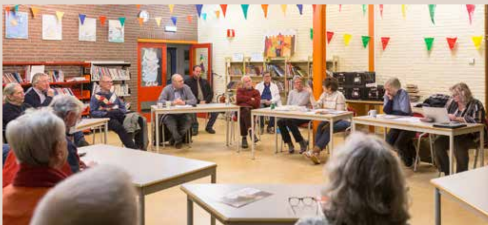
Vergadering van Bewonersplatform Weezenhof op maandag 21 februari 2022

Door de ontwikkelaar werden alle aanpassingen afgewezen, met het argument dat ze financieel niet haalbaar zijn. Een verzoek onzerzijds om dat argument met harde cijfers te onderbouwen werd weggewuifd. Ondanks onze constructieve opstelling werd ons geen enkele handreiking gedaan. De onwrikbare houding van Dornick B.V.