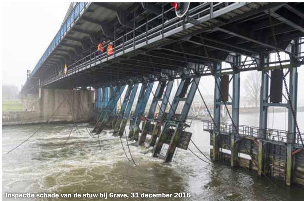
Inspectie schade van de stuw bij Grave, 31 december 2016

Afgelopen 29 december vijf jaar terug vond nabij Nijmegen een bizar rivierongeluk plaats. De schipper van binnenvaarttanker Maria Valentine koos in vette mist op de Maas bij Grave de verkeerde ‘afslag’.