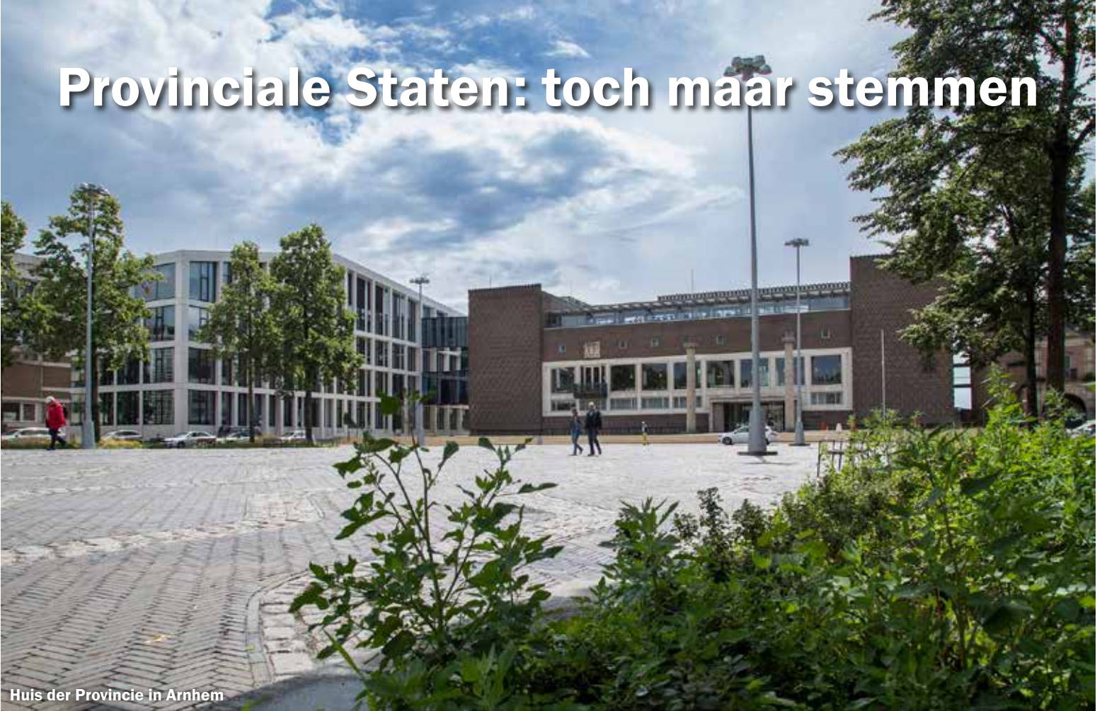
Huis der Provincie in Arnhem

Op 15 maart mogen we weer stemmen. Deze keer voor de provincie, ofwel de Provinciale Staten.