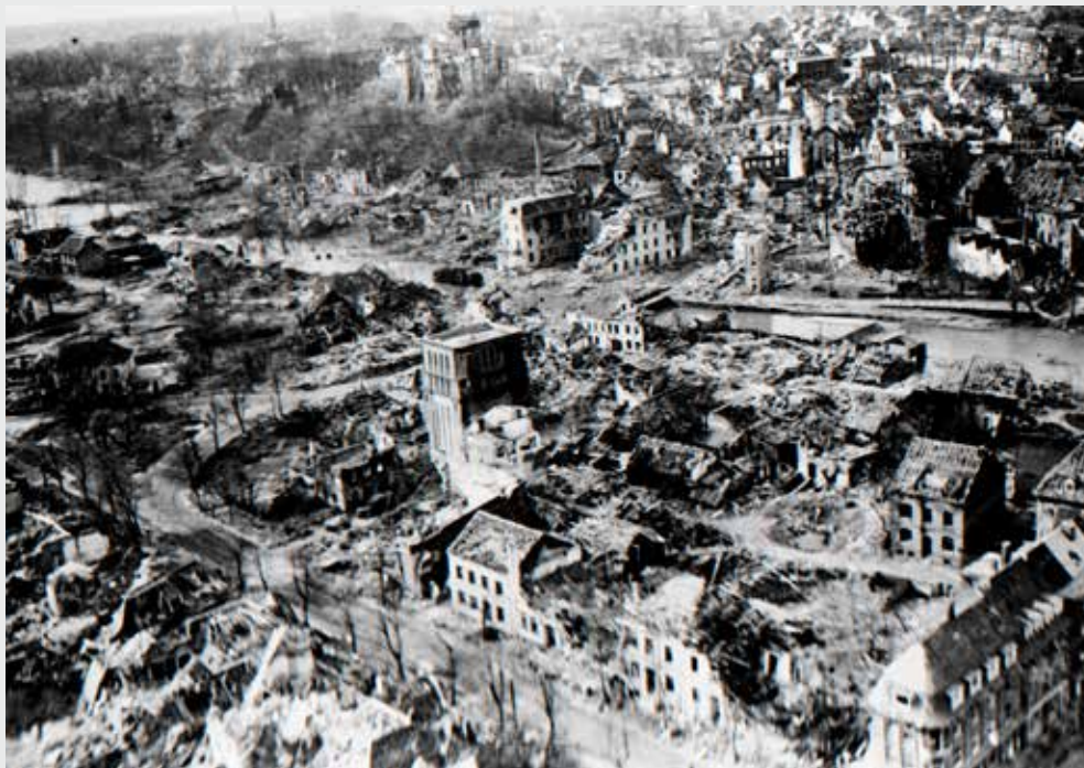
Kleef na de bombardementen van oktober 1944 en februari 1945