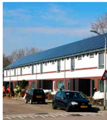
Nul-op-de-meter-woningen in Meijhorst

Uw buurt verduurzamen: kom donderdag 16 maart naar de Thiemeloods