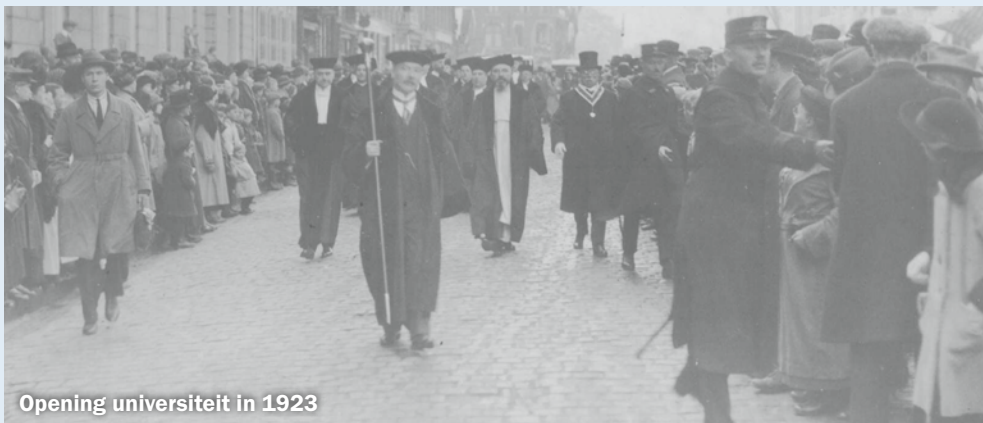
Opening universiteit in 1923