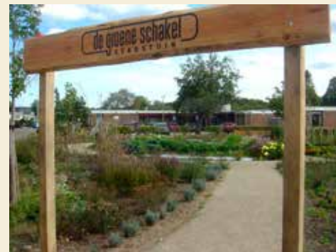
Grootstal: de groene schakel