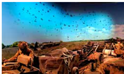
Para's landen en strijders op de grond