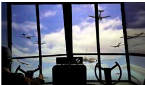
Vliegen over de Ginkelse Hei

een verdieping lager. Onder het bekijken van een film wacht je om toegang te krijgen tot een (nagebouwde) Horsa Glider waarmee je vervolgens op de Ginkelse Heide landt. Als je uitstapt zie je hoe de troepen bewapend waren en je komt daarna opeens middenin de felle gevechten in de Arnhemse straten van 1944. Vervolgens worden de aftocht en vlucht over de Rijn afgebeeld. De strijd rond Oosterbeek en Arnhem kostte 1900 geallieerden en 1800 Duitse soldaten het leven. Nog steeds zijn er 130 soldaten vermist, nooit teruggevonden. Deze Airborne Experience is geheel ondergronds gebouwd.