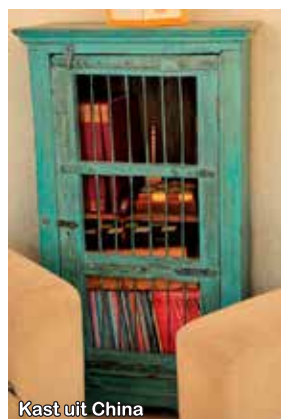
Kast uit China