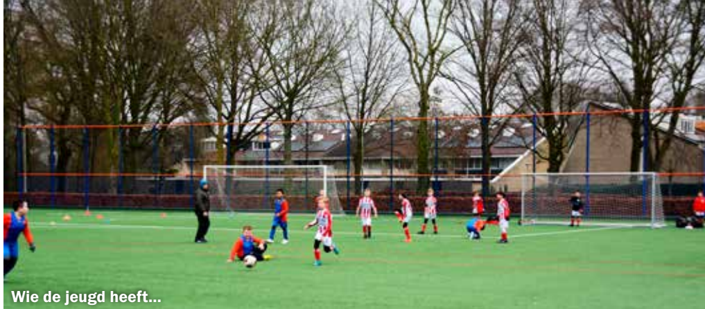
Wie de jeugd heeft...

De vereniging heeft de laatste jaren een moeilijke tijd doorgemaakt en leidde een nagenoeg kwijnend bestaan. Bestuurlijk was niet altijd overeenstemming en zo iets werkt door binnen de gehele vereniging. Veel leden vertrokken naar andere clubs en daarmee nam ook het aantal ploegen af. Gelukkig stond een zevental enthousiaste leden op die vonden dat er iets moest gebeuren. Zij stelden zich kandidaat voor een bestuursfunctie en tijdens de laatste alv (algemene ledenvergadering) werden deze enthousiaste mensen gekozen tot bestuurslid. Er kon dus een 'nieuwe wind' gaan waaien binnen de vereniging.