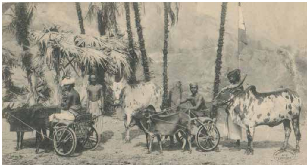
Foto links: Malabares-troep met vier jongens/mannen boven in de bamboestaken. Foto boven: Indiërs met riksja's en zebu's.

aan het werk zien. Wijl zich bij den troep een elftal kinderen bevindt, is er ook een school, waar de kleinen van hun meester onderricht in lezen, schrijven en rekenen ontvangen.