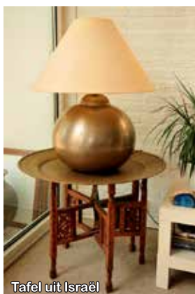
Tafel uit Israël