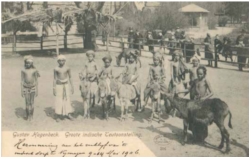
Indische kinderen met ezeltjes op de Indische tentoonstelling van 9 tot en met 14 mei 1906.

Deze expositie is hier te lande nog met verschillende bezienswaardigheden verrijkt geworden, die van de factorij der firma te Co-