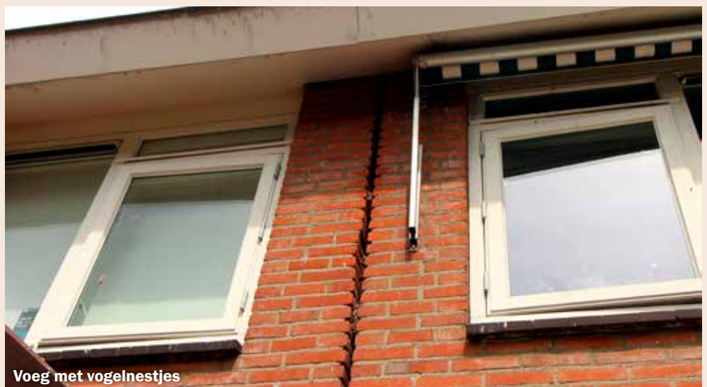
Voeg met vogelnestjes

Donderdag 26 januari - de afspraken tussen bewoners en de steigerbouwer waren al gemaakt - kwam er een vervelend bericht. Alles werd weer afgezegd. De grote bouwkraan die gereserveerd was, de levering van materialen, de steigers noem maar op. In ieder geval toch weer een financiële schadepost. Wederom bleek het