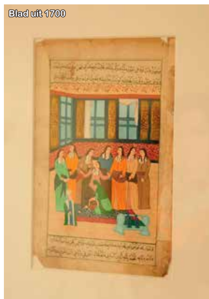
Blad uit 1700