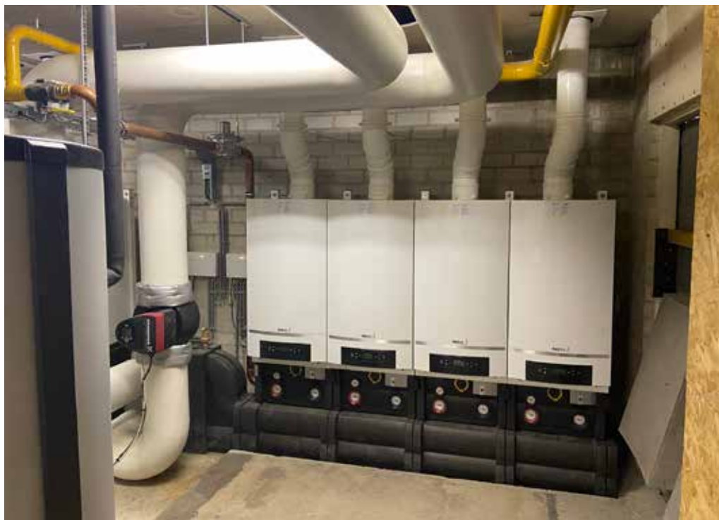
Vier hr-ketels in cascadeopstelling ten behoeve van centrale verwarming

‘Door de gestegen energiekosten zetten sommige mensen de verwarming ’s avonds lager, maar het lukt ze dan niet om overdag deze weer goed op warmte te krijgen. Hierin wordt duidelijk dat wij onze communicatie moeten verbeteren wanneer er zoveel nieuwe technieken worden toegepast bij een renovatie. Wij moeten betere uitleg geven en ook vaker, over in dit geval het nieuwe verwarmingssysteem. Wij begrijpen dat het wennen is aan het nieuwe laagtemperatuur verwarmingssysteem. Deze moet je bijvoorbeeld niet ’s avonds op 15 graden zetten, zoals bij het oude systeem. Dan krijg je het namelijk niet op tijd comfortabel de volgende dag. Het kost veel minder energie om een appartement met een laagtemperatuur verwarmingssysteem op temperatuur te houden dan bij een normaal systeem. Daarnaast hebben we alle woningen geïsoleerd en is er