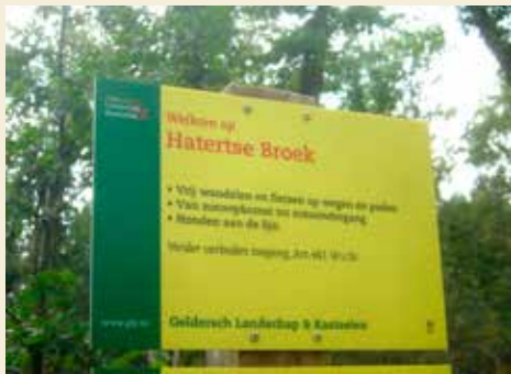
Hatertse Broek: verborgen groen aan rand Dukenburg

Een gezond motto: wandel en zoek het groen op. Want enkele uren per week 'groen' bewegen is goed voor je gezondheid. In en rondom Nijmegen is er genoeg groen om in te wandelen. De vernieuwde site Struinbulletin helpt je bij het zoeken naar groene routes in en om de stad Nijmegen. Maar je vindt er ook artikelen over vergroening.