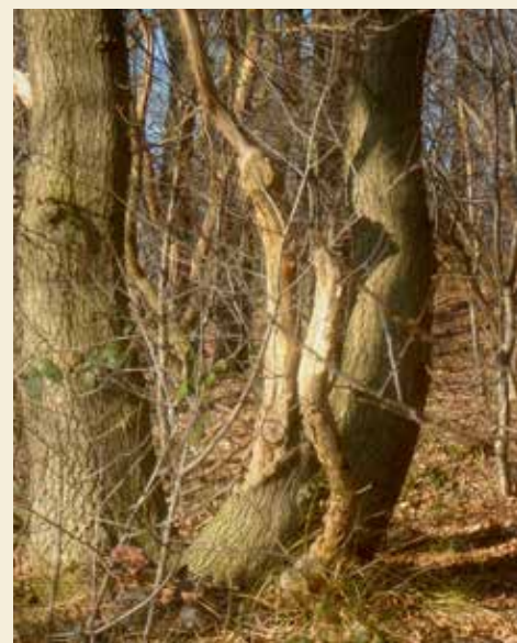
Heumens Bos: lente met Valentijn