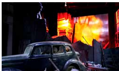
Strijd in Arnhem