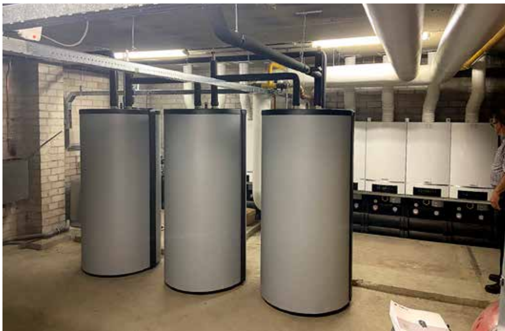
Drie 500-liter-boilers en daarachter de zeven verwarmingsketels

Door het uitzetten van de verwarming zakt in koudere periodes de temperatuur tot wel