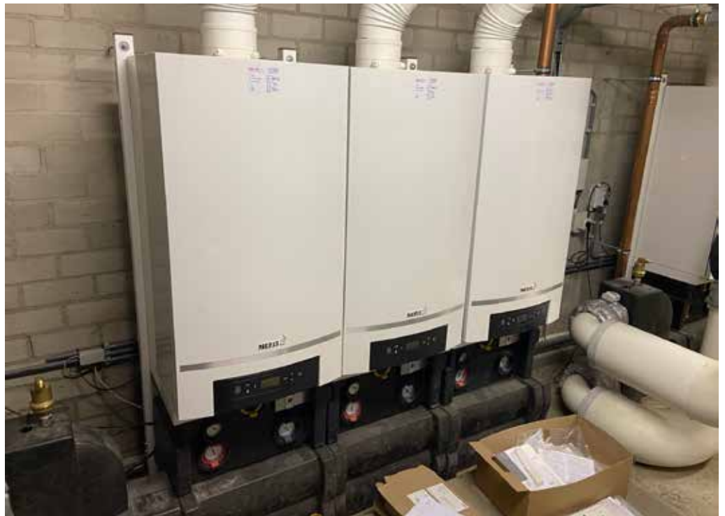
Drie hr-ketels in cascadeopstelling ten behoeve van warm tapwater

geeft eigenlijk alleen maar verliezers. Terwijl voor de corporatie dit verwarmingsprobleem het bespreekpunt is, zien de bewoners het veel groter. Ook al is er nu een compleet nieuwe verwarmingsinstallatie met zeven nieuwe verwarmingsketels en zijn er drie nieuwe 500-liter-warmwaterboilers geplaatst, de problemen