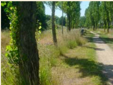
Wolfskuil/Hees: laantje in park West

Wandelroutes krijgen op den duur te maken met veranderingen en moeten daarom regelmatig gecontroleerd en bijgesteld worden. Dat kost veel tijd en lopen. Dat is de reden waarom website Struinbulletin vanaf februari 2023 op een andere manier is gaan werken. Niet meer wandelroutes of groenartikelen downloaden, maar per mail aanvragen. Op de site kun je de Catalogus Struinbulletin inkijken. Daarin staan alle