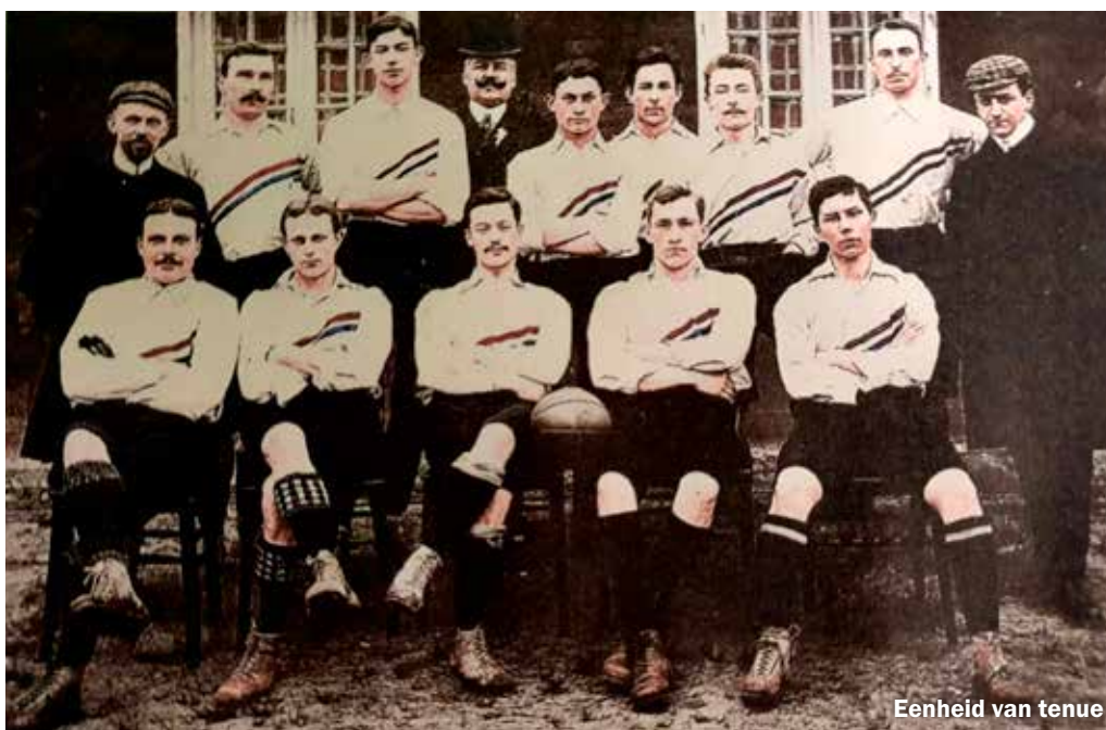
Eenheid van tenue