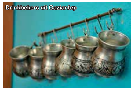
Drinkbekers uit Gaziantep