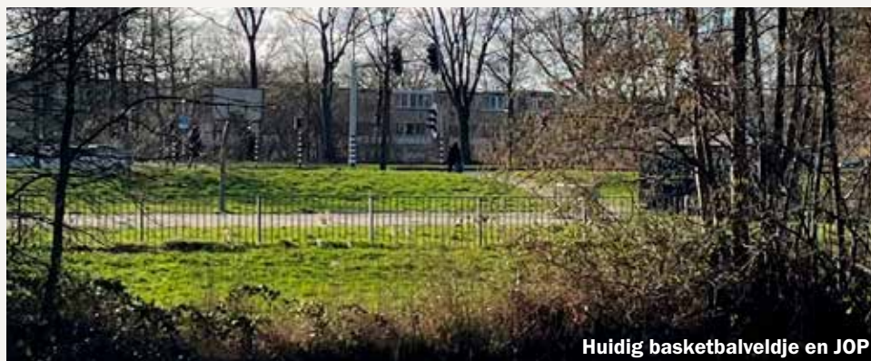
Huidig basketbalveldje en JOP

Zwanenveld krijgt een modern basketbalveld. Dat is het voornemen van Bindkracht10 en het sportbedrijf van de gemeente. Dit voorjaar moet het gereed zijn.