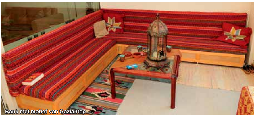
Bank met motief van Gaziantep