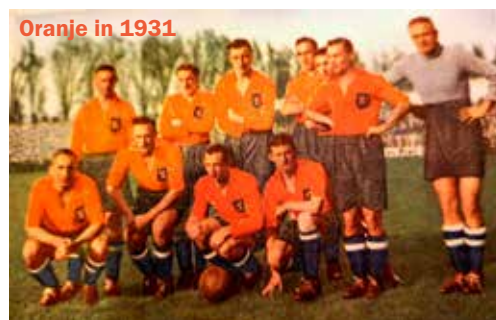
Oranje in 1931

In 1905 voelde het team zich 'ingespeeld' en durfde als Nederlands Elftal tegen officiële elftallen van andere landen te spelen. De rij van interlandwedstrijden werd geopend tegen België in Antwerpen. De wedstrijd eindigde in een gelijkspel 1-1. Maar dit vond men geen resultaat om mee naar huis te nemen. Met algemene stemmen werd besloten de wedstrijd met een half uur te verlengen. Daarin waren de Nederlanders het sterkst en wonnen met 4-1. Deze eerste officiële wedstrijd maakte een eind aan het improviseren. De elftallen werden niet meer samengesteld door een commissie maar door de bond zelf. Ook de voetbaltenues werden uniform. Eerst speelde iedereen in het shirt en broek van de eigen vereniging en was het een bonte verscheidenheid. Het eerste uniforme tenue van het Nationale Elftal bestond uit een wit shirt met een rood-wit-blauwe sjerp daarover heen.