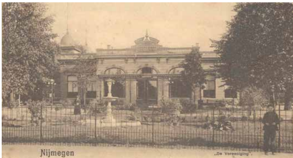
Sociëteit „de Vereeniging” in 1905. Het eerste gebouw. Het huidige gebouw stamt uit 1915.

Even belangwekkend zal het dorp zijn, waar de leden van den troep in de pauzen verblijven, en waar de handwerkers hunne dagelijksche bezigheden zullen verrichten. Daar kan met wevers, gouborduuders, koperwerkers, schilders, vervaardigers van aardwerk, benevens den beroemden hout- en ivoorsnijder