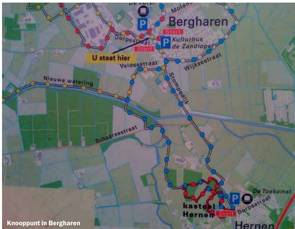
Knooppunt in Bergharen

Na het eeuwenoude voetspoor van de Tempeliers in hartje Maas en Waal gevolgd te hebben is een korte blik in de geschiedenis op zijn plaats. Deze ridders bouwden 800 jaar geleden bij Hernen een versterkte boerderij. Zij hadden als taak het beschermen van pelgrims. Om Bergharen en andere plaatsen te bereiken, waaierden de ridders en de pelgrims door de naaste omgeving. Net als de minivierdaagselopers anno 2023. Toen het Tempeliersverblijf vlak achter het romantische, te bezoeken kasteel in Hernen verdwenen was, werd er een nieuwe boerderij geplaatst met de naam Tempel. Kom je ergens in het kippendorp een woning tegen met de naam de Vette Knip , denk dan aan het legendarische dak aan de Van Rosenbergweg nabij Dukenburg: de Hippe Kip . De behuizingen waren zeg maar familie van elkaar.