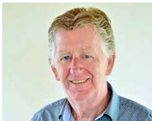
Samenstelling: Leo Venderbosch

81 procent van de mantelzorg wordt gegeven aan iemand buiten het eigen huishouden van de mantelzorgers, het meest aan de uitwonende ouders. In Nijmegen kunt u voor uw mantelzorger weer het mantelzorgcompliment van 200 euro aanvragen. Op de site van de gemeente Nijmegen of ga even naar de Stip in Wijkcentrum Dukenburg.