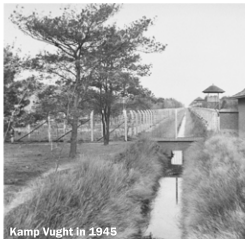
Kamp Vught in 1945