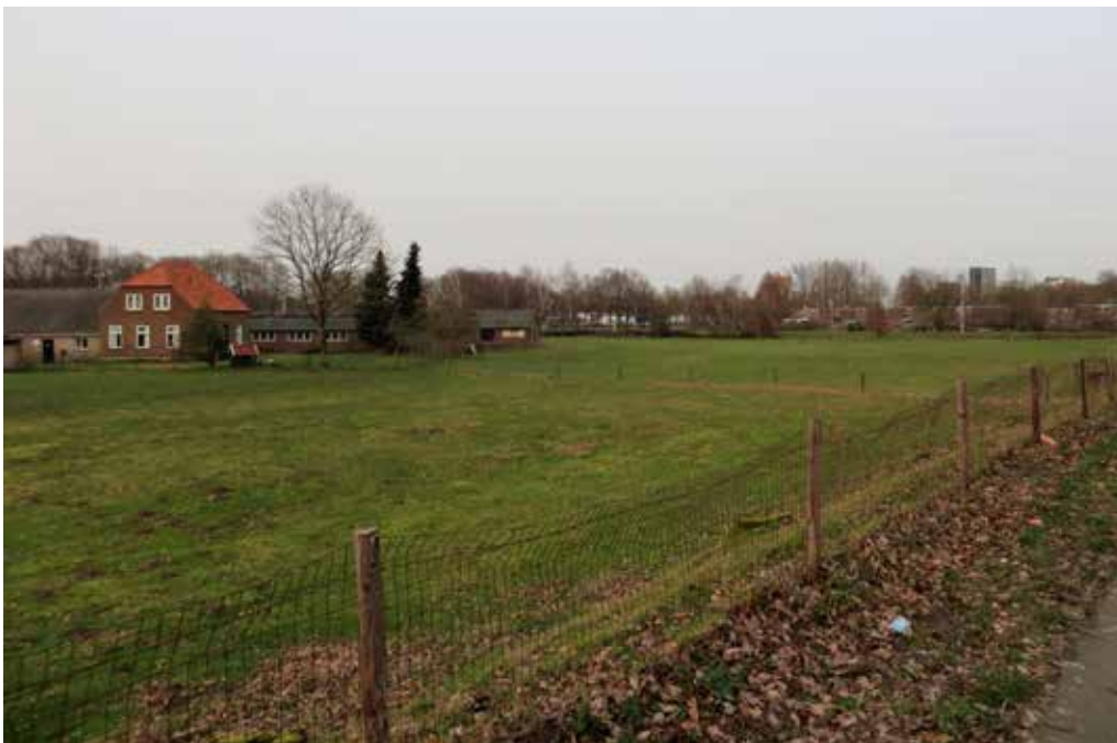
Het terrein van de Hippe Kip tussen Teersdijk en Van Rosenburgweg