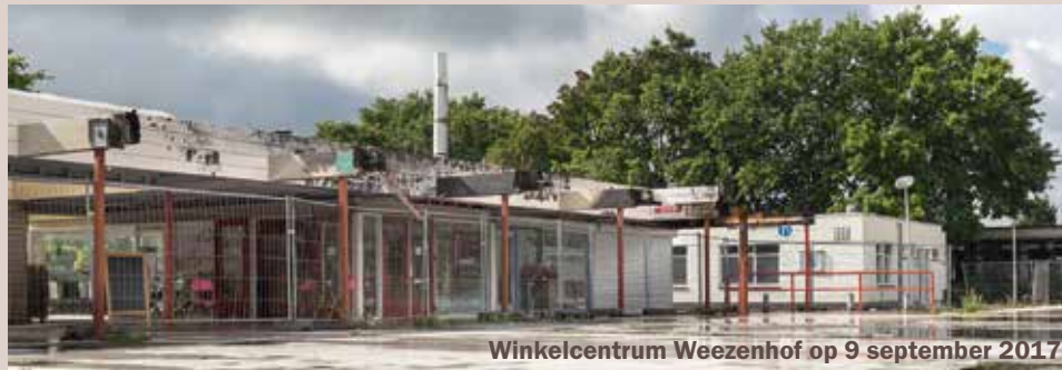
Winkelcentrum Weezenhof op 9 september 2017