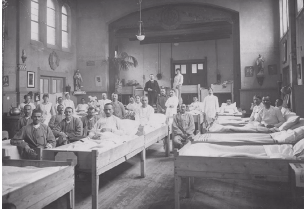
Servische consul bezoekt hulpziekenhuis in Rotterdam, februari 1919

Maar er waren ook veel andere chronische restgevolgen van de Spaanse griep. Die kwamen pas bij later onderzoek aan het licht. Veel