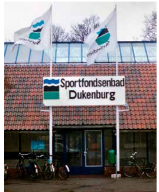
De entree in 1997

de begane grond. Het personeelsverblijf ging naar de eerste verdieping. Verder kwam er een ruimere hal waardoor een grotere 'doorkijk' ontstond. De niet-zwemmende, wachtende bezoeker had daardoor meer ruimte. Een doorn in het oog was al langer de ingang van het bad. Deze was onopvallend, waardoor je van afstand niet direct in de gaten had dat dit de toegang van het zwembad was.