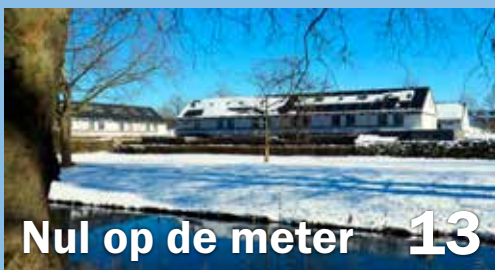
Nul op de meter