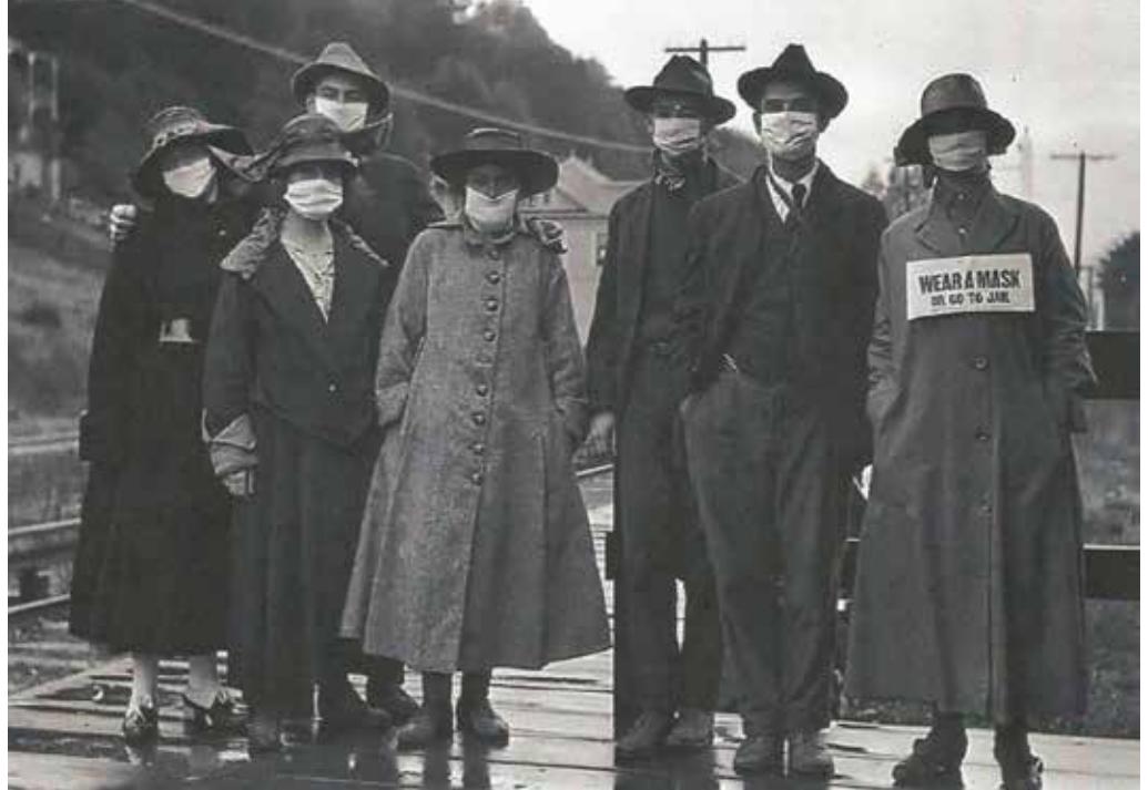
'Wear a mask or go to jail' (Draag een masker of ga naar de gevangenis). Californië, 1918

De mondkapjes hielpen weinig. Toen een tweede golf kwam wilden de mensen die niet meer dragen. Men ziet dan een echt publieke terugslag in het dragen, ondanks dwingende maskeraanbevelingen. Weerstand tegen het dragen van gezichtsbedekking is dus niet nieuw. In 1918 noemden mensen ze vuilvallen.