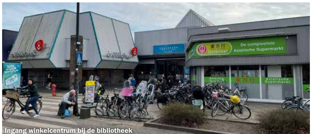
Ingang winkelcentrum bij de bibliotheek

Tekst en foto onder: René van Berlo Portretfoto: collectie Paul van Doorn