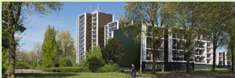
Deze flats in Weezenhof komen voor in het boek 'Mijn favoriete gebouw in Nijmegen'

Zusje in Lankforst als ooit de orangerie van landgoed Duckenburg. Die andere Orangerie in Malvert zou best eens in het moderne oog gaan lopen, als de metamorfosetijd voorbij is. De Wollewei is vooral binnenshuis innovatief uitgevoerd, evenals de Horizon in Meijhorst. Hierdoor terug in hartje Dukenburg, waar ook de sporthal zodanig opgeknapt werd dat het gebouw eigentijds geworden is. En dan, pal ernaast die Oostduitse KPN-bunker met die enorme mast, hoe is die ooit in deze woonwijk terechtgekomen? O, als knooppunt voor telecommunicatie, tuurlijk. Functioneel, maar allesbehalve fraai. Gelukkig wel vrij van grafiti, dankzij de hoge hekken rondom. Verlaten we Meijhorst via de Staddijk, dan staan daar enkele vrijstaande Dukenburger woningen, met de boerderij (Michi) als ouwetje, maar wel doorlopend gemoderniseerd. Aldenhof kunnen we bijna links laten liggen, hoewel je er met de achtertuinen aan het Snoeckaert-van-Schauburgpad parallel aan de Van Apelterenweg grote vrijstaande huizen aantreft. Op de hoek bij de toegang tot Aldenhof ziet ook het kantoor van WoonGenoot er apart uit. Minder curieus als je weet dat het eerst een vierkant ketelhuis was met