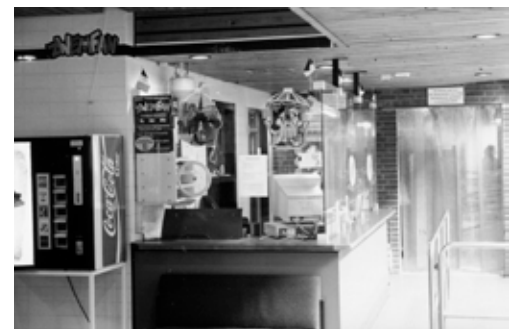
Receptie in 1997

De verbouwingswerkzaamheden waren ook gericht op het achterstallige onderhoud dat hiermee weggewerkt werd. Uiteindelijk kwam het 'sein op groen'. In maart 1997 kon begonnen worden met de werkzaamheden.