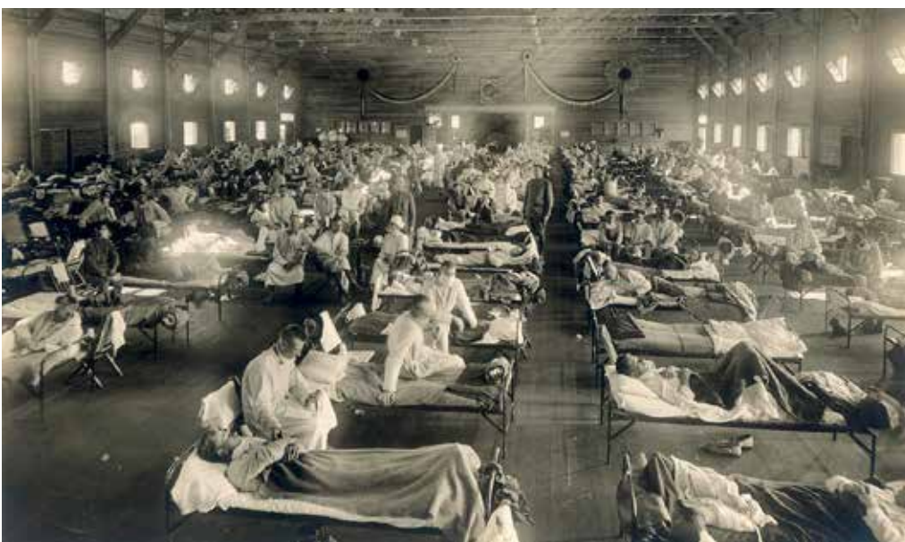
Noodhospitaal tijdens de Spaanse griep, Camp Funston, Kansas, Verenigde Staten

In sommige landen was de griep een aanleiding om de straat op te gaan en te demonstreren tegen de regering. Omdat het aantal slachtoffers snel opliep, ontstond het idee dat de regering niets of te weinig deed. Vooral in Duitsland waren er tegen het einde van de oorlog muiterijen onder de militairen, die rond de vredesonderhandelingen in opstanden en publieke wanorde eindigde. Dit had ook invloed op bestuurlijk Nederland omdat zij de onrust kon aanjagen. Soms werden restricties opgelegd die ongrondwettelijk waren. Men vroeg zich af of de democratie in de knel kwam. >>