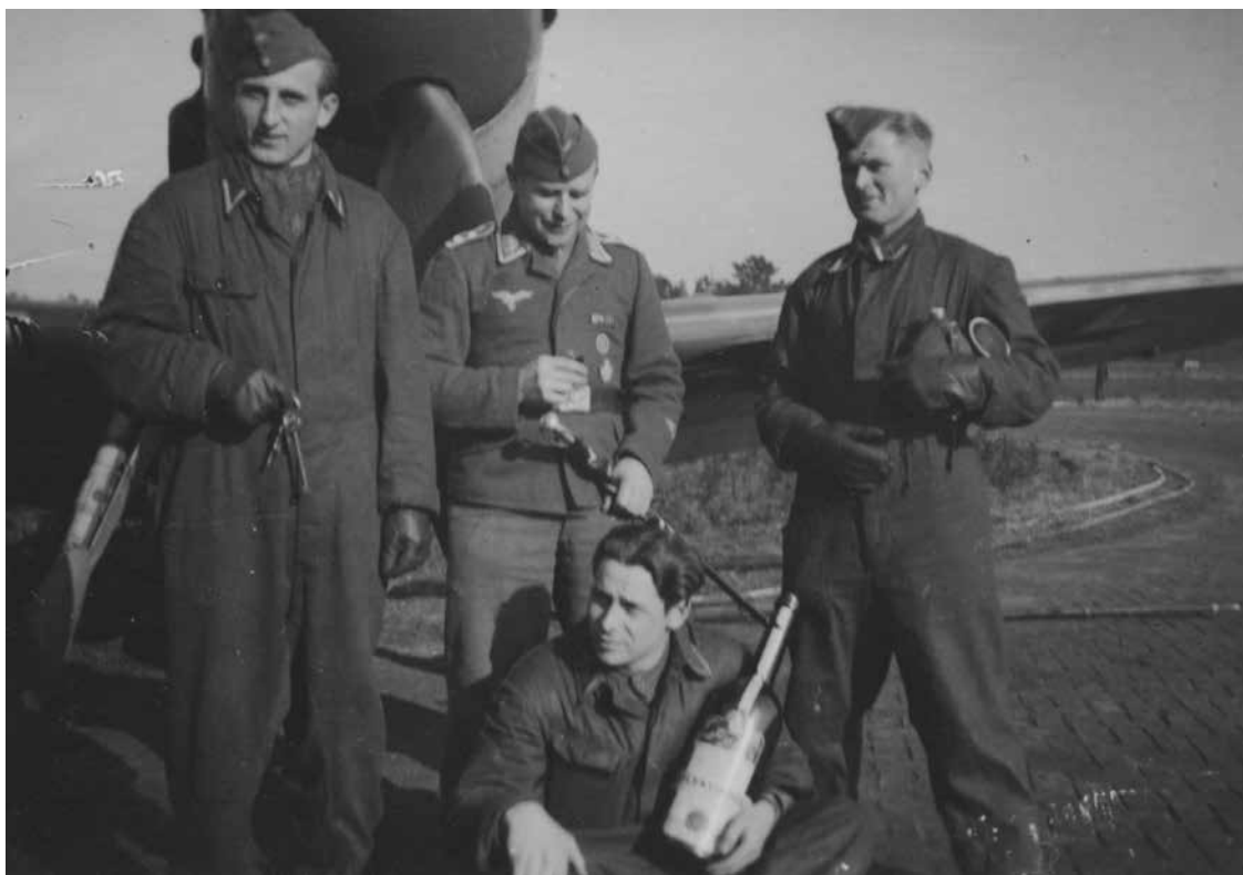
Personeel van de Werftzug van de I./JG 3 (waarvan de naam in deze tijd wordt gewijzigd in II./JG 1) poseert met een fles drank voor een Messerschmitt Bf 109 op vliegveld Volkel. Mogelijk vieren zij een behaalde mijlpaal van de Werftzug.

Sinds kort is er een ommetje genaamd Kop van Malden* ). Dukenburgers kunnen langs Couwenbergstraat en verdere toeristische routes door Hatert de grens Nijmegen/Malden bereiken, waar de Heumense Hatertseweg het ommetje schampt. En wel in de bocht bij boerderij Berkenbosch. Zó dichtbij Dukenburg dus. Officieel begint het ommetje bij Intratuin/Coffijn aan de Rijksweg, voert dan via Elleboog, de Hoge Brug en het fietspad langs het kanaal tot aan Berkenbosch (einde fietspad). Vervolgens langs het Brouwerijpad, rechtsaf richting huize Elshof met oprijlaan, vandaar links/rechts zigzaggend richting Sint Jacobsweg. Jazeker, een weg die (ook) leidt naar Santiago de Compostella. De Rijksweg overgestoken via de parkeerplaats Kluissestraat naar de Bosweg, de Sportweg en de Nertsstraat, komt de sportieveling terecht op het pad Airstrip B.91. En wat treft hij/zij daar aan? Sporen uit de lucht! Ondergebracht op een teksttableau en een gedenkteken. Nieuwsgierig geworden? Ga eens kijken.