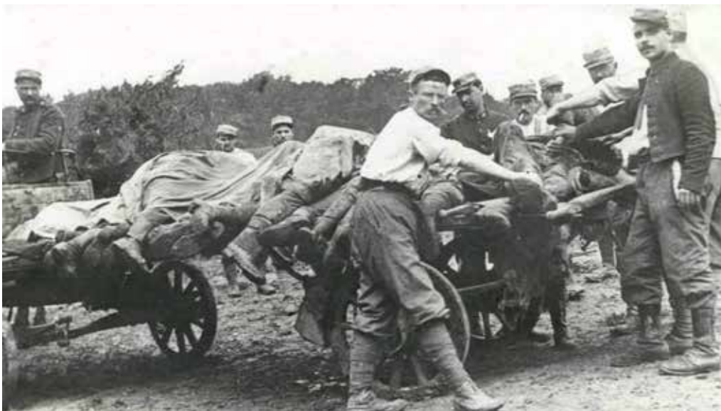
Een kar volgeladen met lijken van slachtoffers van de Spaanse griep

Dan waren er de vele gevallen van slaapziekte (encefalitis lethargica, ofwel EL) na de griepgolf. Hieraan stierven wereldwijd een half miljoen mensen. Deze ziekte werd in de beginfase gekarakteriseerd door slaperigheid en vermoeidheid. Later kregen deze patiënten ernstige neurologische klachten die vrij vaak tot de dood leidden. Ook in Nederland zag men in de jaren 1921 en 1922 veel patiënten die naast de slaapzucht een uiteenlopende reeks van neuropsychiatrische klachten toonden. De ziekte is jarenlang vergeten geweest. De Spaanse griep liet de psyche ook niet onaangeroerd. Door de sociale isolatie en vereenzaming, de angst en radeloosheid ontstond een groot aantal psychische klachten, vooral bij de meer labiele personen. In diverse landen werden meer psychiatrische opnames gezien en nam het aantal suïcides toe, onder andere door vereenzaming. In het Verenigd Koninkrijk was er in 1919 en 1920 als gevolg van deze griep een toename van het aantal psychiatrische en neurologische aandoeningen. Door het sluiten van de scholen en door sterfte van de docenten gedurende de epidemie liepen veel kinderen een leerachterstand op. Die werd nauwelijks ingehaald en had op de latere levensloop een blijvende negatieve invloed.