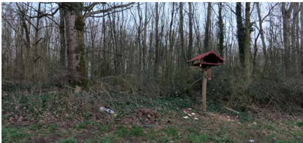
Deel van het bosgebied waar een leeftlaag is aangebracht over zwaar vervuilde grond

Tenslotte is er een deel van het bosgebied op het terrein. Enkele tientallen jaren geleden vond er een bodemsanering plaats. Pikant detail: in opdracht van de gemeente werd zwaar vervuilde grond toen niet afgevoerd maar ter plekke in een diepe kuil gestort. Dit is nog steeds te zien op internet. Ga naar YouTube en tik als zoekwoord Teersdijk in. In een vorig leven als provinciaal politicus heeft uw redacteur deze kwestie aangekaart bij zowel het provincie- als gemeentebestuur. Er kwam een onderzoek van Deloitte waaruit bleek dat er strafbare feiten waren gepleegd. Maar die feiten waren verjaard. De gemeente heeft vervolgens een leeftlaag aangebracht bovenop deze stort waardoor daar volgens haar weer veilig gewoond zou moeten kunnen worden.