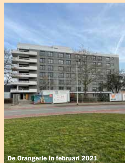
De Orangerie in februari 2021