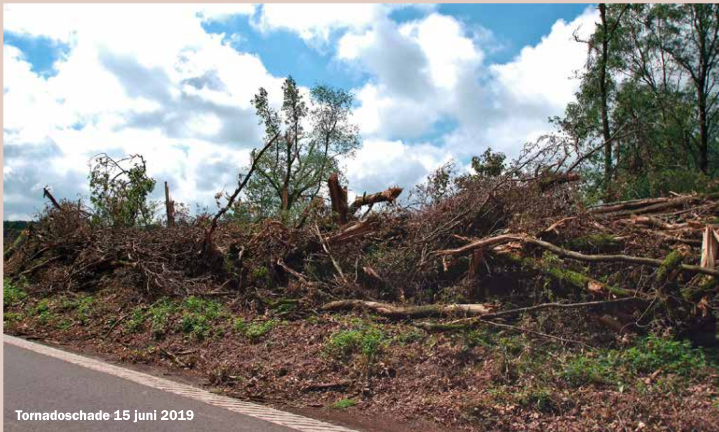
Tornadoschade 15 juni 2019