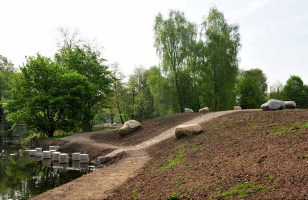
De Geologenstrook is in 2010 ingrijpend opgeknapt. Deze foto's zijn toen gemaakt. Boven: Nu is overal hoog gras. De stapstenen zijn niet meer bereikbaar. Rechts: Wetering langs het Geologenlaantje in het zuidelijke deel. Op de achtergrond de brug die vervangen wordt door een 3D-versie.