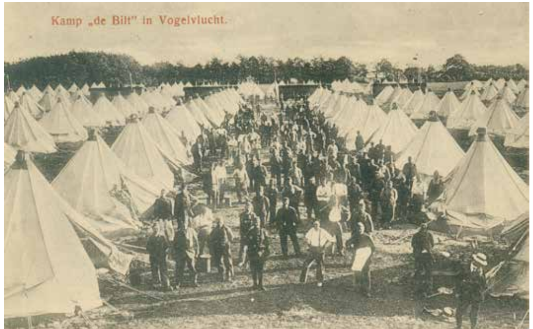
In dergelijke kampen waren Nederlandse dienstplichtigen gelegerd, Kamp de Bilt, 23 juli 1917

Ook in Nederland manifesteerde de griep zich als eerste in garnizoensplaatsen. Dat gebeurde rond mei 1918. De geneeskunde stond vrijwel machteloos tegen deze griepgolf. Allerlei therapieën werden beproefd, te vergeefs. Militairen verkeerden in een extra kwetsbare positie, omdat zij door de slechte legering elkaar hoestend de luchtweginfecties doorgaven. De Spaanse griep was daarom de grootste killer, ook van onze gemobiliseerde militairen in de