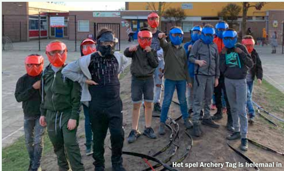
Het spel Archery Tag is helemaal in

Vanuit het kinder- en jongerenwerk van Bindkracht10 worden samen met de kinderen en jongeren wekelijks activiteiten in de wijken en op de scholen in Dukenburg georganiseerd.